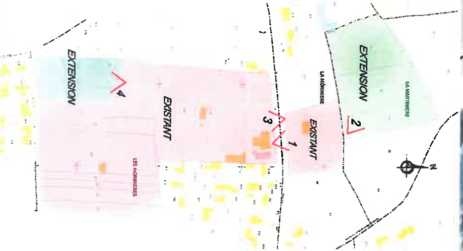
Photos du 29 avril 2013