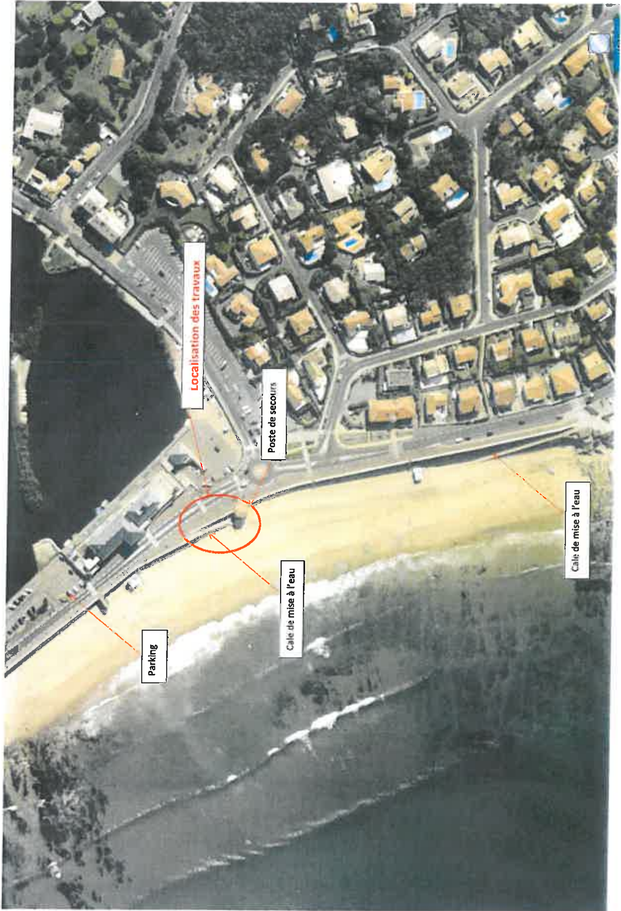
Photographie aérienne (échelle 1/2000 ème )