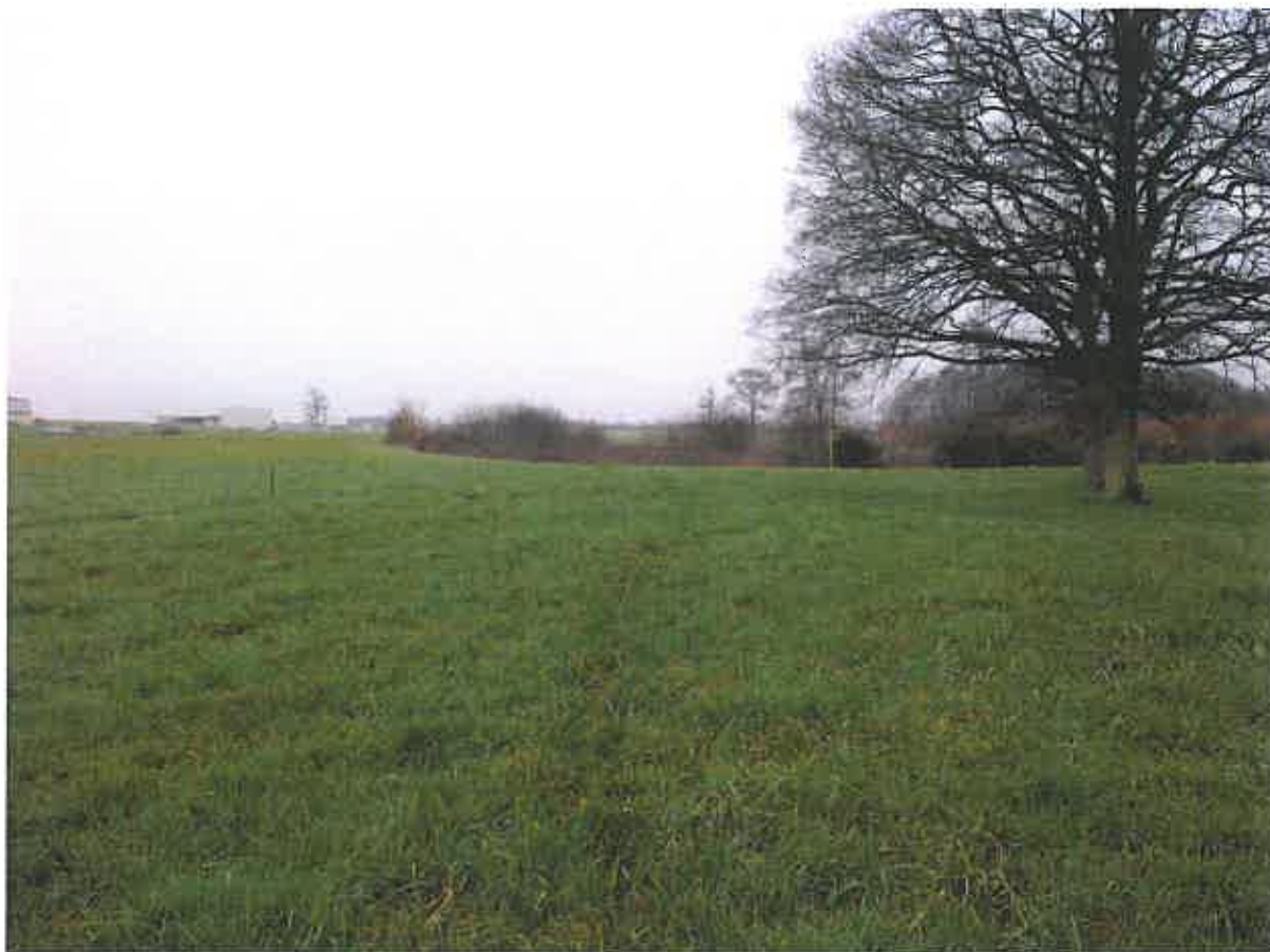
Annexe°5 : Photo n°2