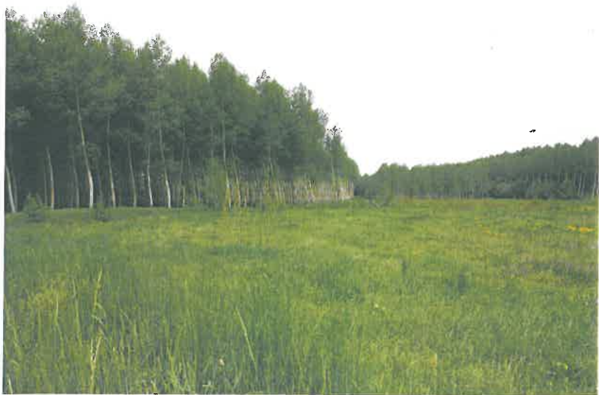
Photo 2 : Vue de la peupleraie dont une partie a été exploitée en 2009 (Mai 2012).