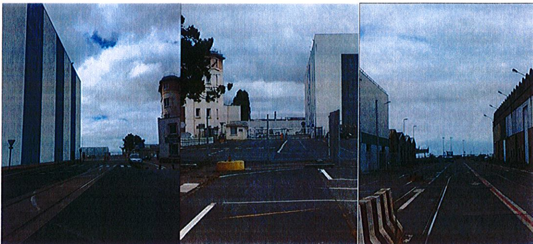
Accès parking couvert