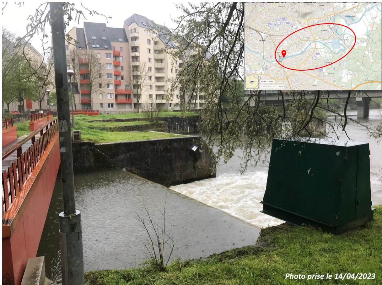
Photo prise le 14/04/2023