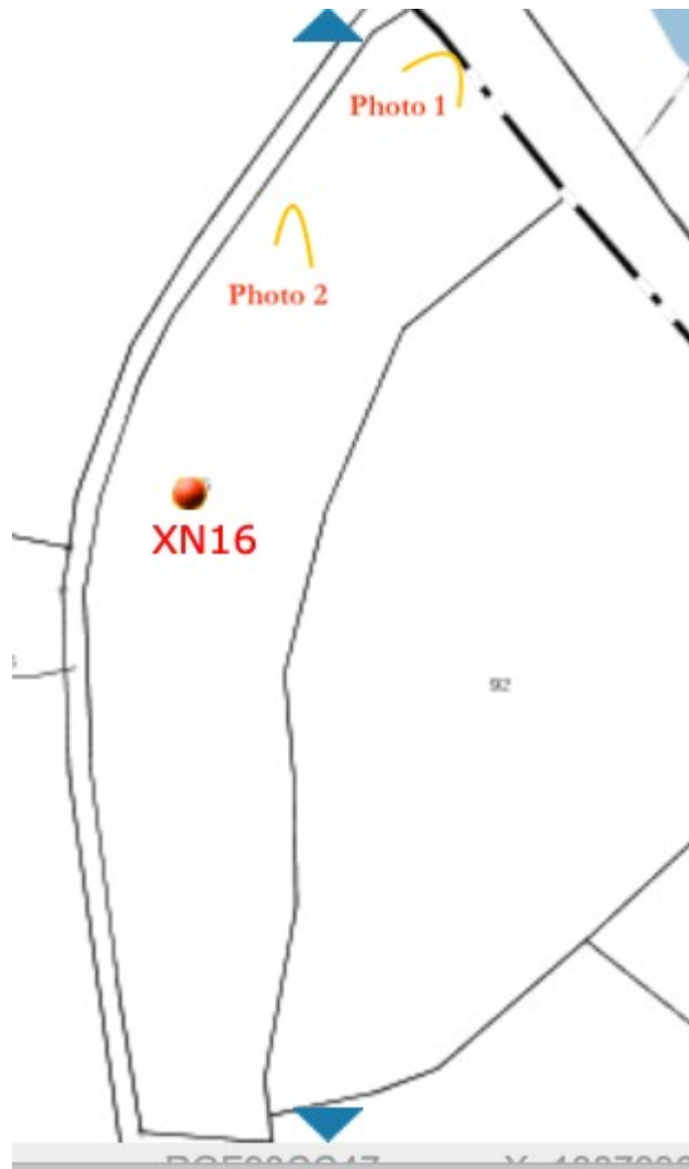
Localisation des prises de vues