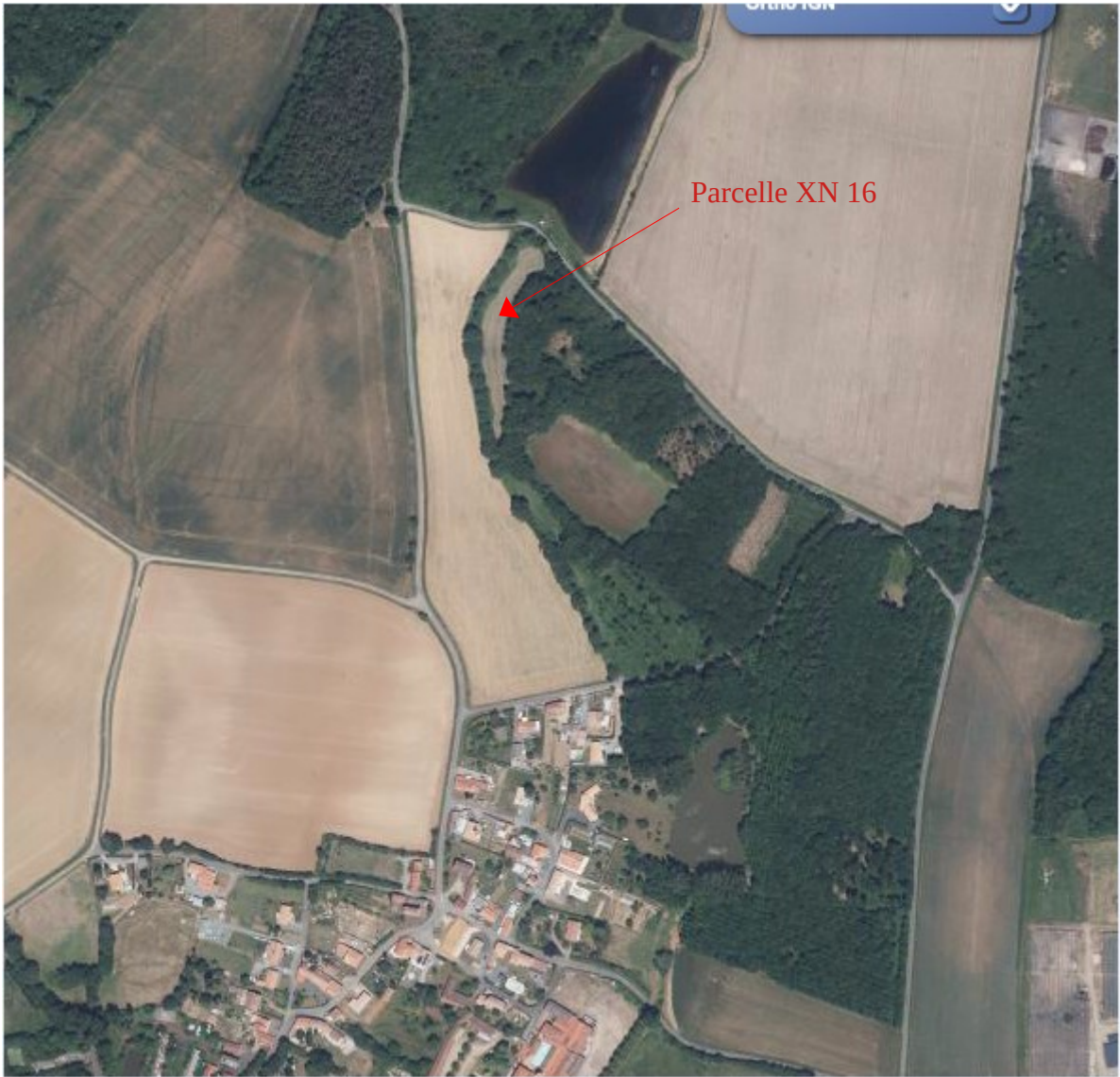
Vue aérienne du site