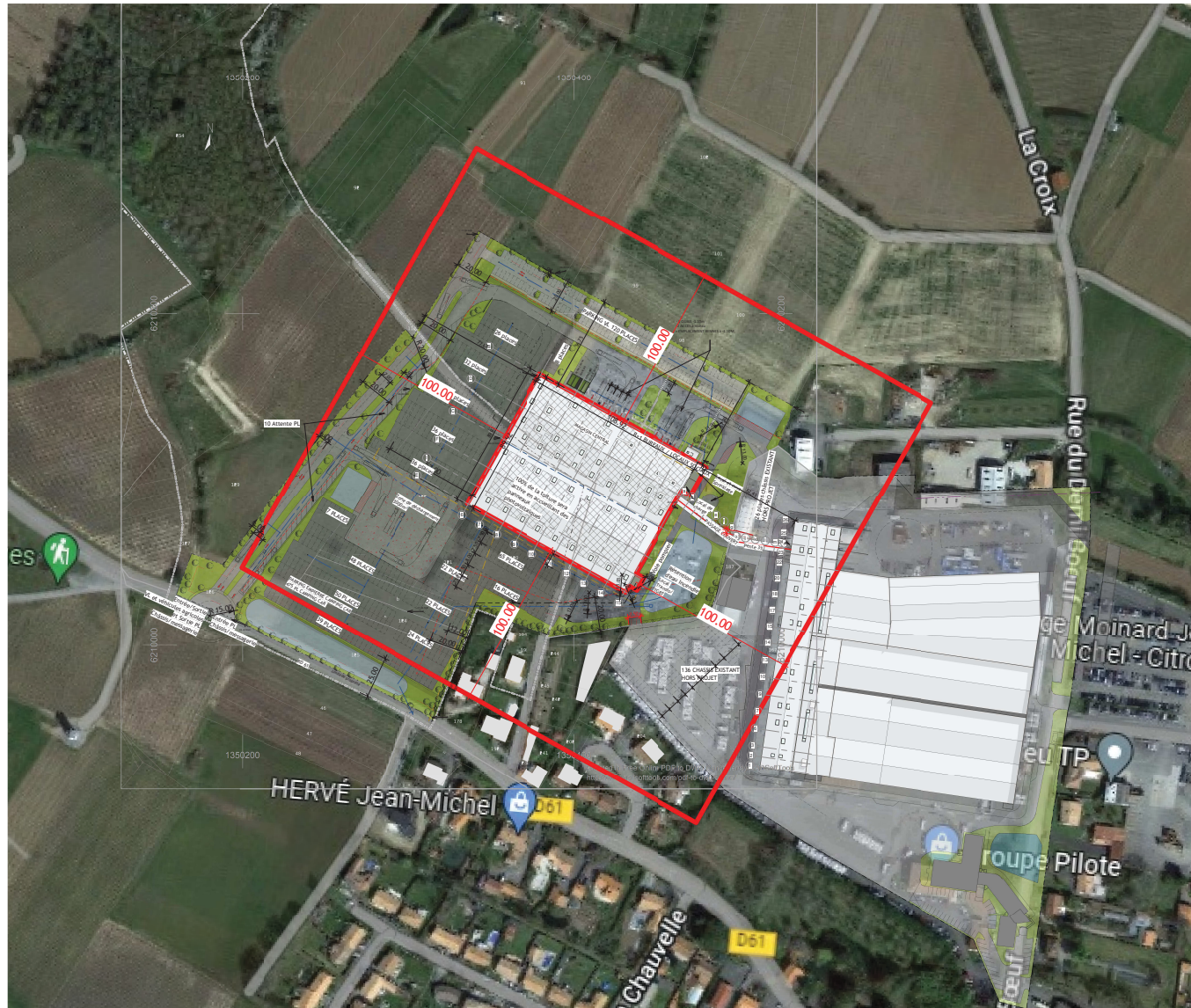
Plan Masse 100 m Ech : 1 : 5000

MAITRE D'OUVRAGE GP SAS Rue du Demi-Boeuf 44310 LA LIMOUZINIÈRE