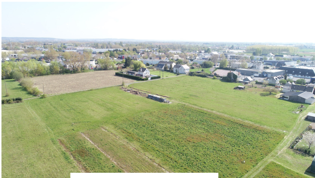
Prise de vue n°1