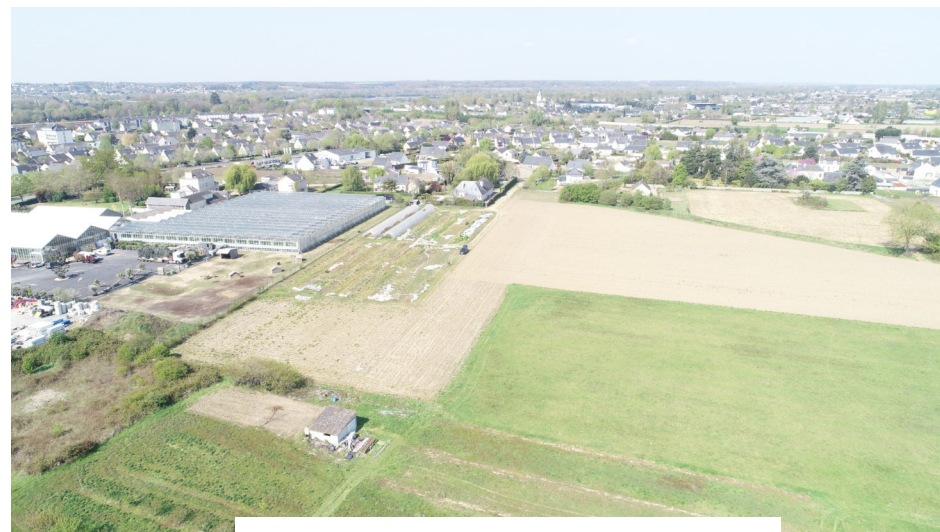
Prise de vue n°2