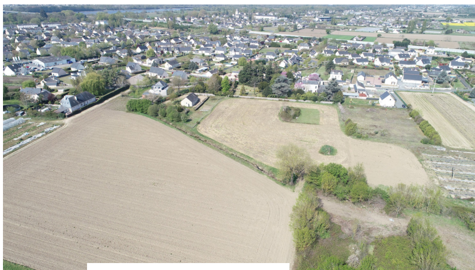
Prise de vue n°3