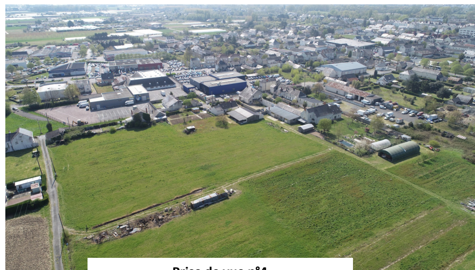
Prise de vue n°4