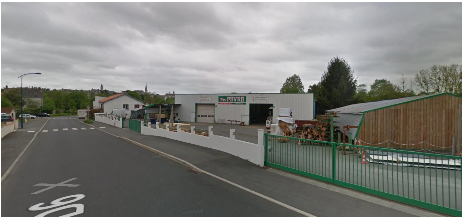
PRISE DE VUE N°1 – PHOTO AVRIL 2018