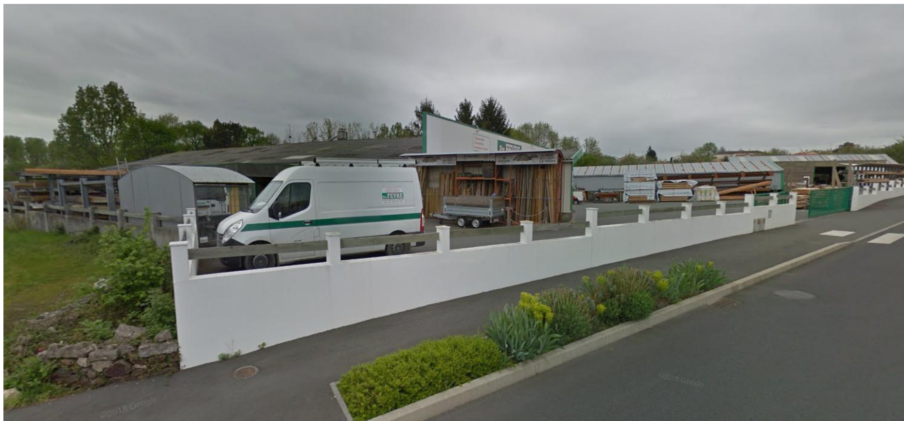
PRISE DE VUE N°3 – PHOTO AVRIL 2018