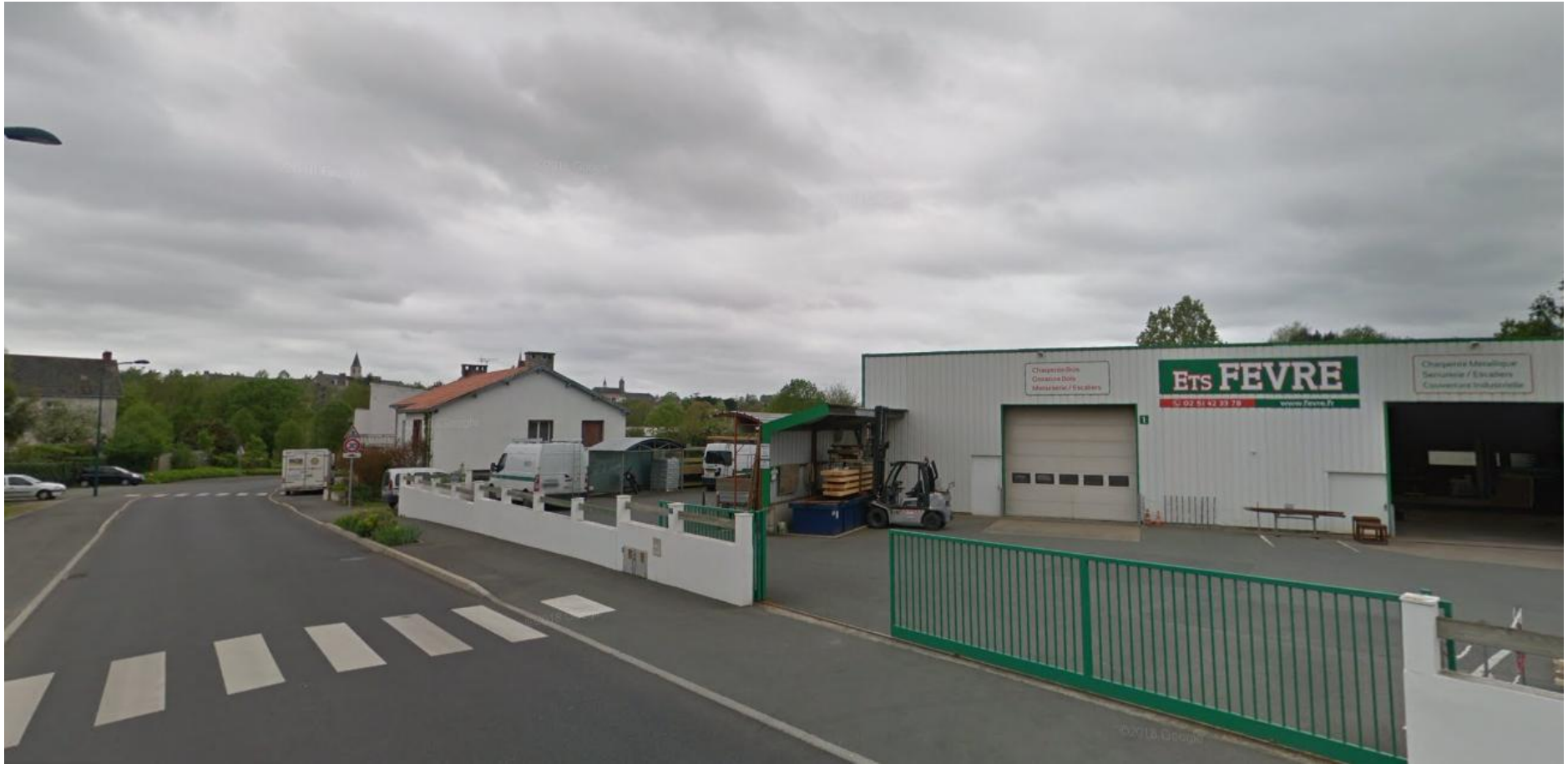
PRISE DE VUE N°2 – PHOTO AVRIL 2018