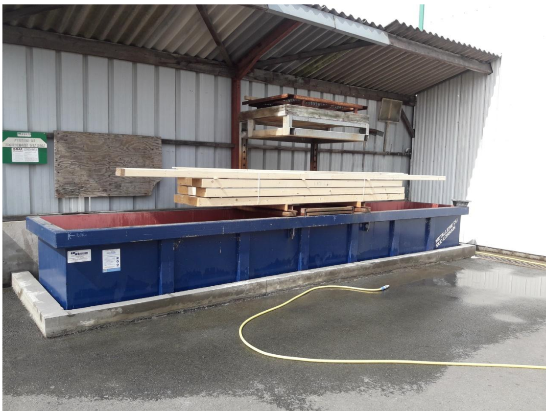
PRESENTATION DE LA CUVE DE TRAITEMENT (PHOTO JUILLET 2019)

D'une superficie de 7 914 m 2 , le site comporte un bâtiment pour le travail du bois et quelques activités de serrurerie, non classés vis-à-vis de la nomenclature, des zones de stockage de bois, une partie bureaux, un local pour le stockage du matériel de chantier et la cuve de traitement en extérieur sous abri.