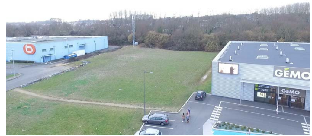
Photographie aérienne - environnement proche - 15.02.2017