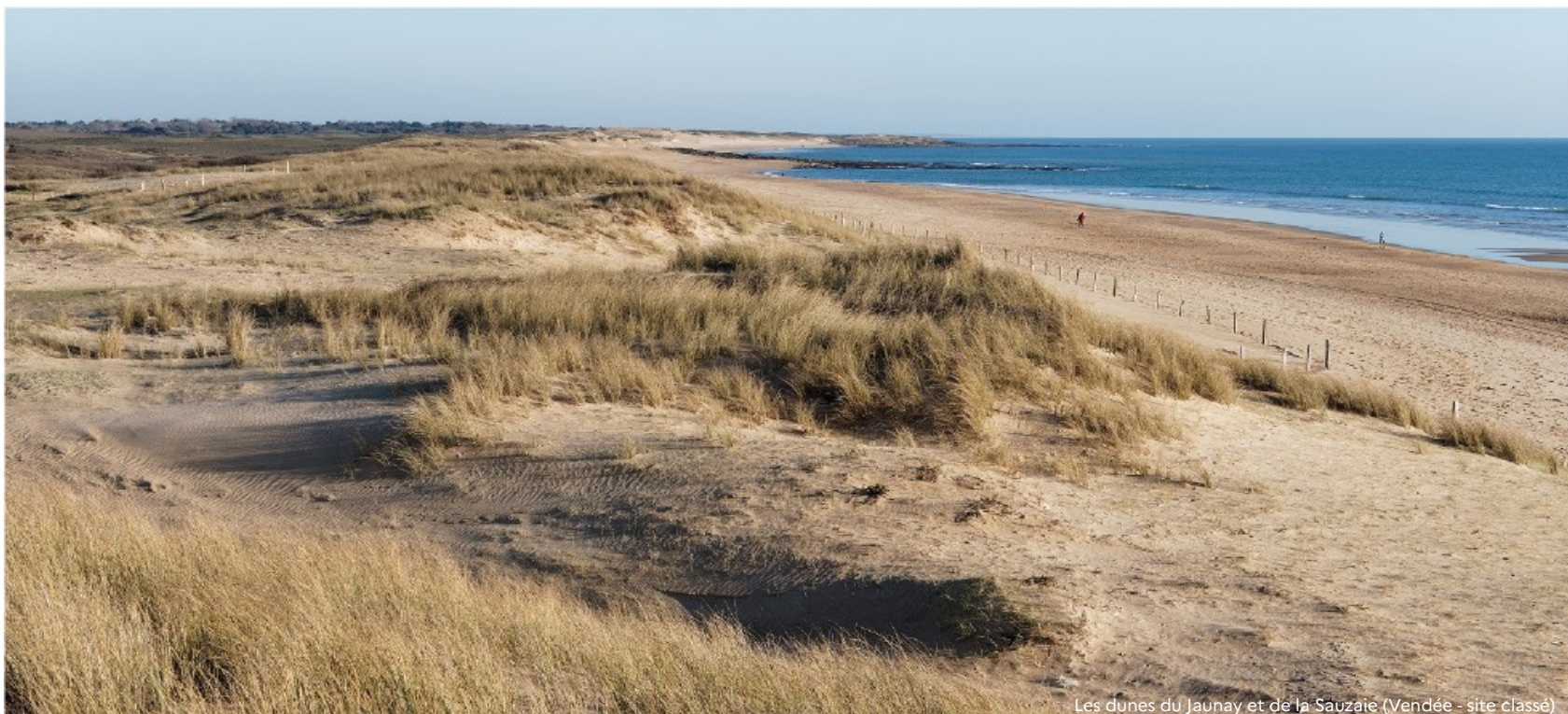
Les dunes du Jaunay et de la Sauzaie (Vendée - site classé)