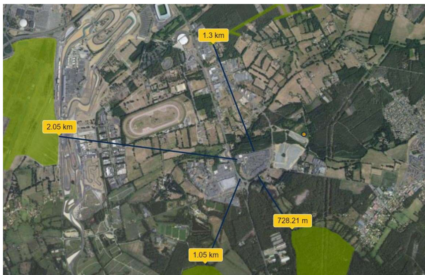
ZNIEFF type I