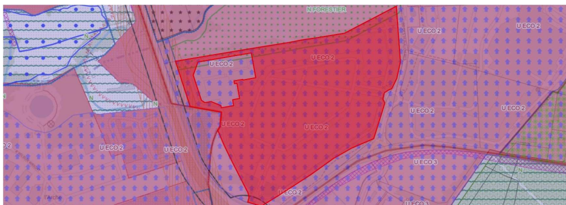
PLU zone U ECO 2