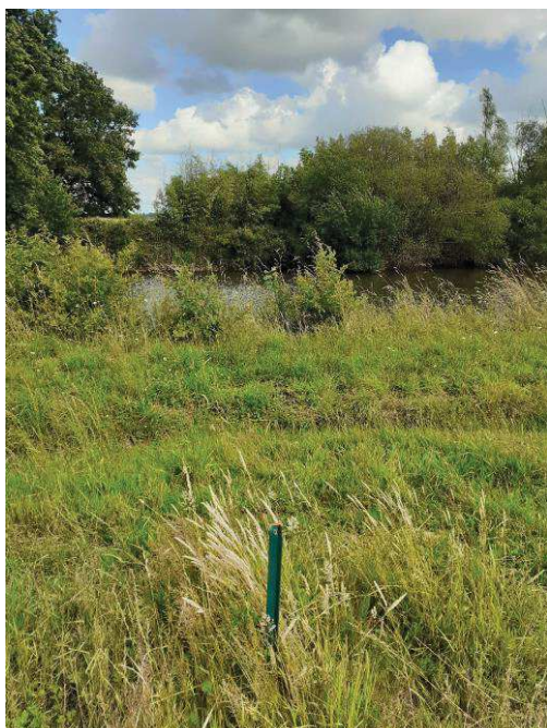
Vue direction est