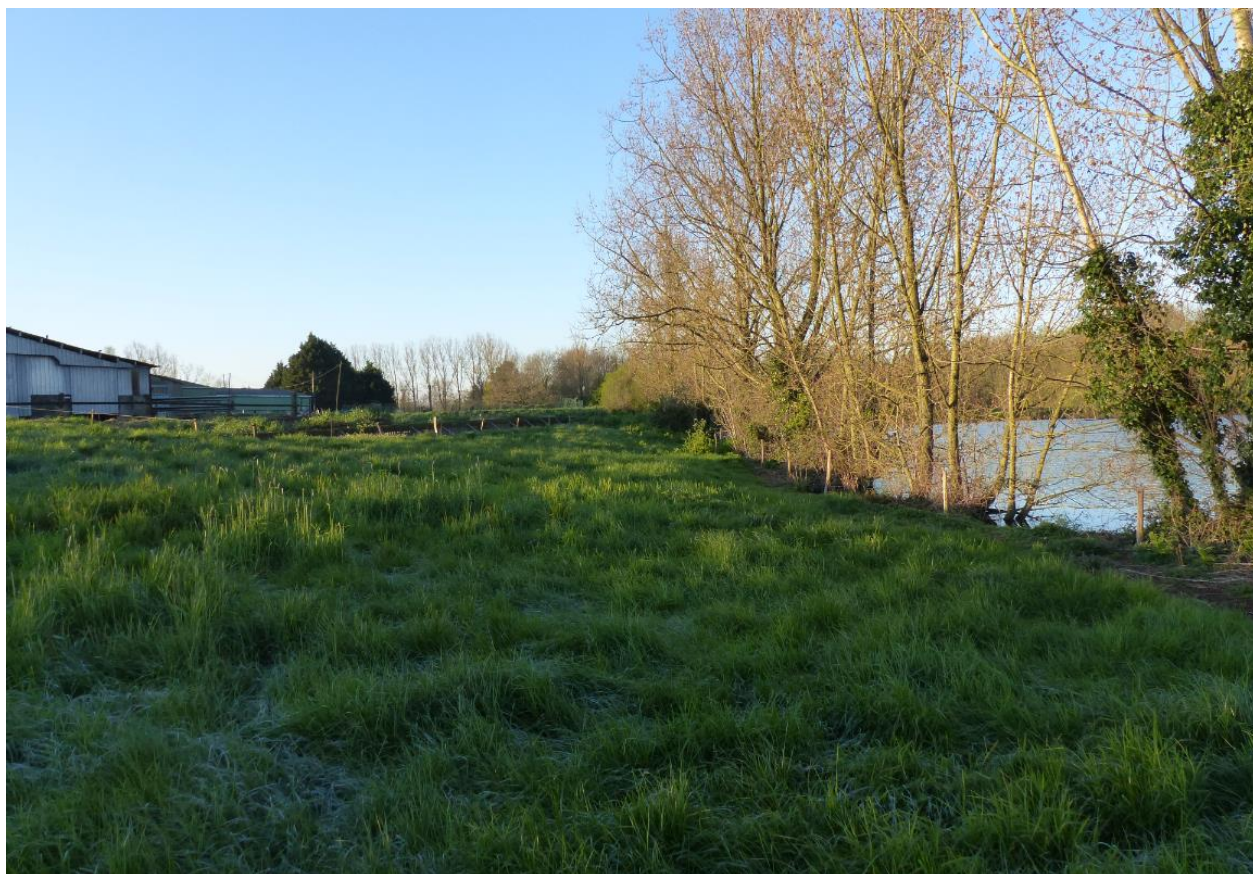
Photo1 (25 mars 2020)