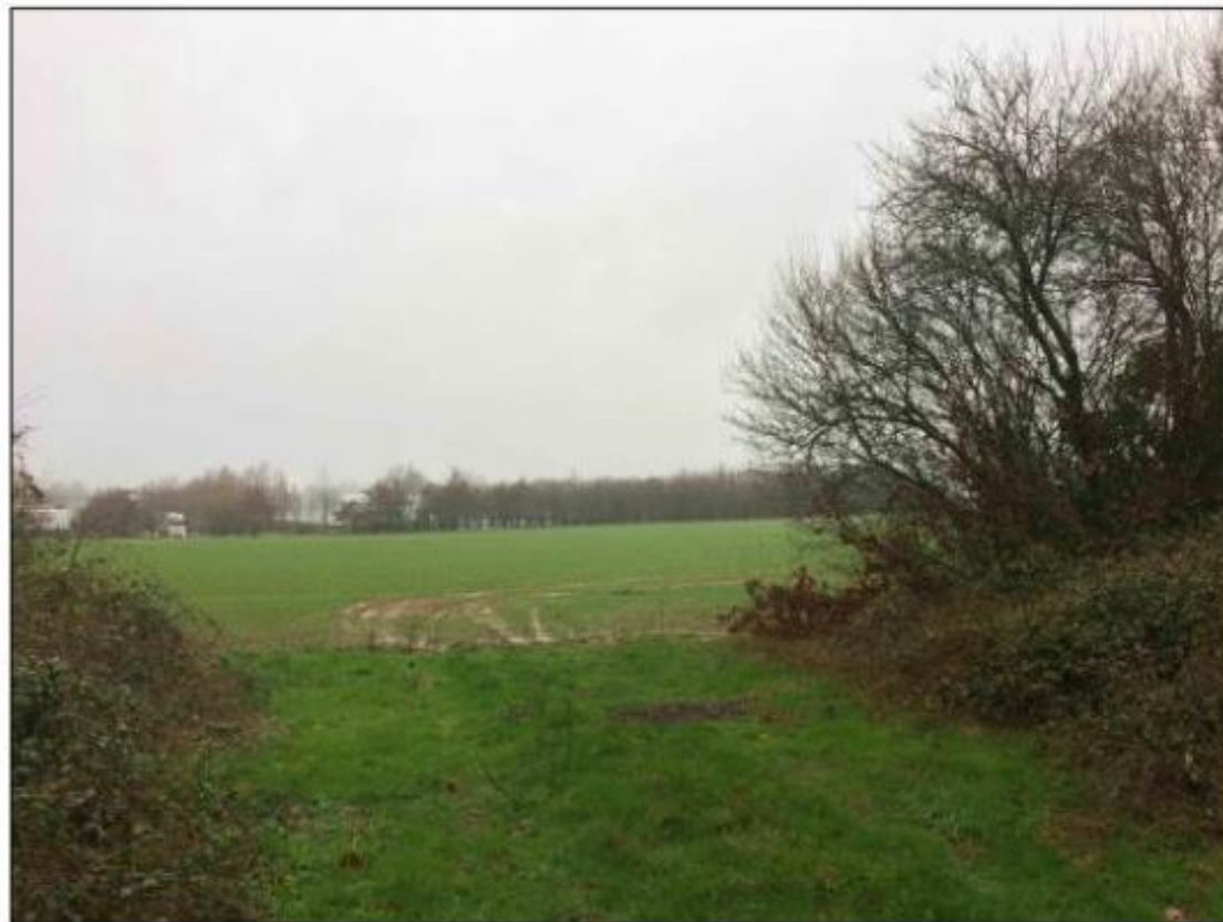
Figure 33 : Vue 1