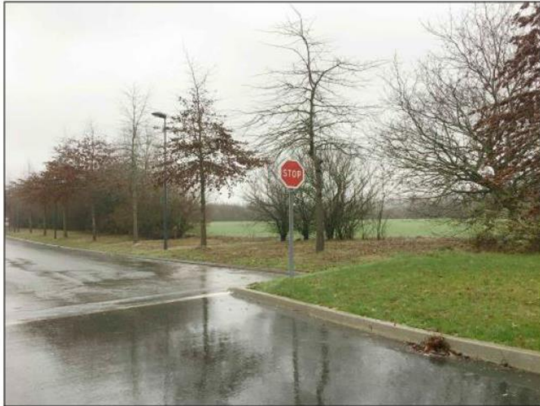
Figure 34 : Vue 2