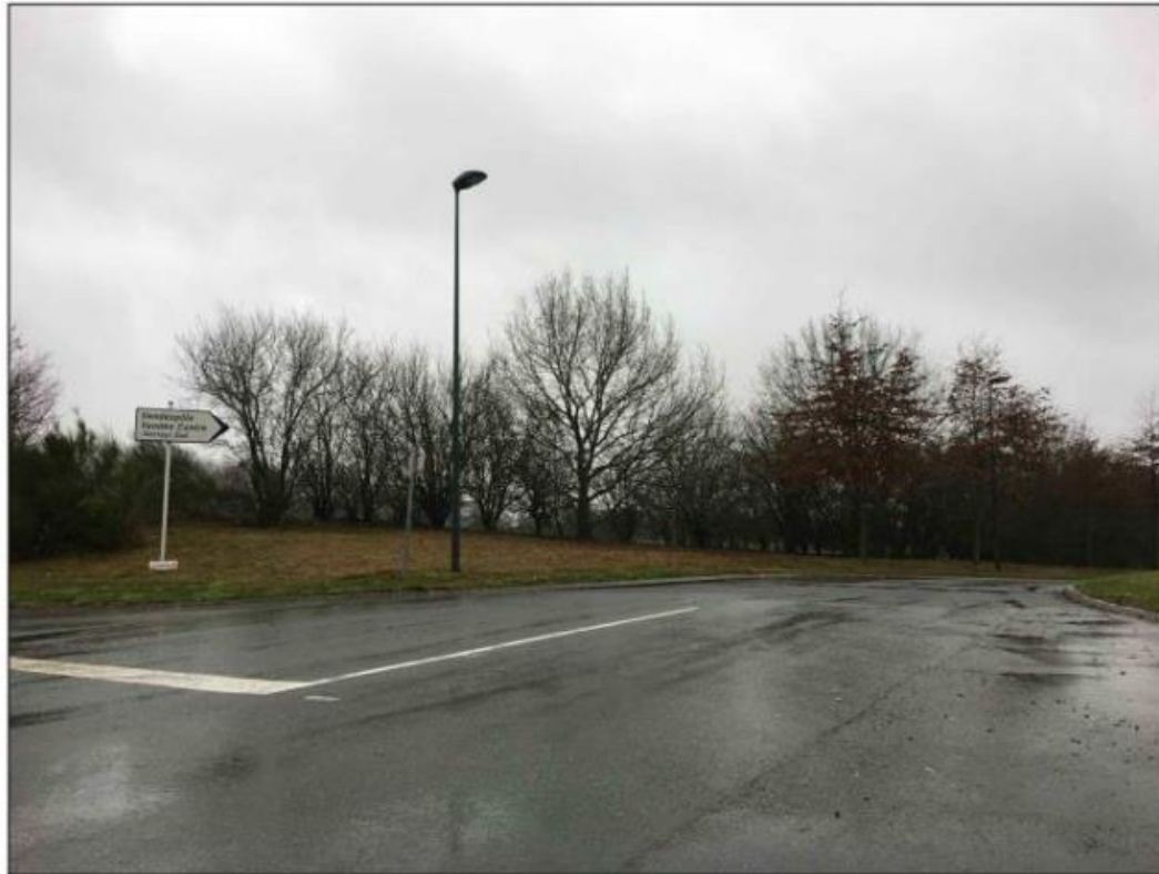
Figure 35 : Vue 3