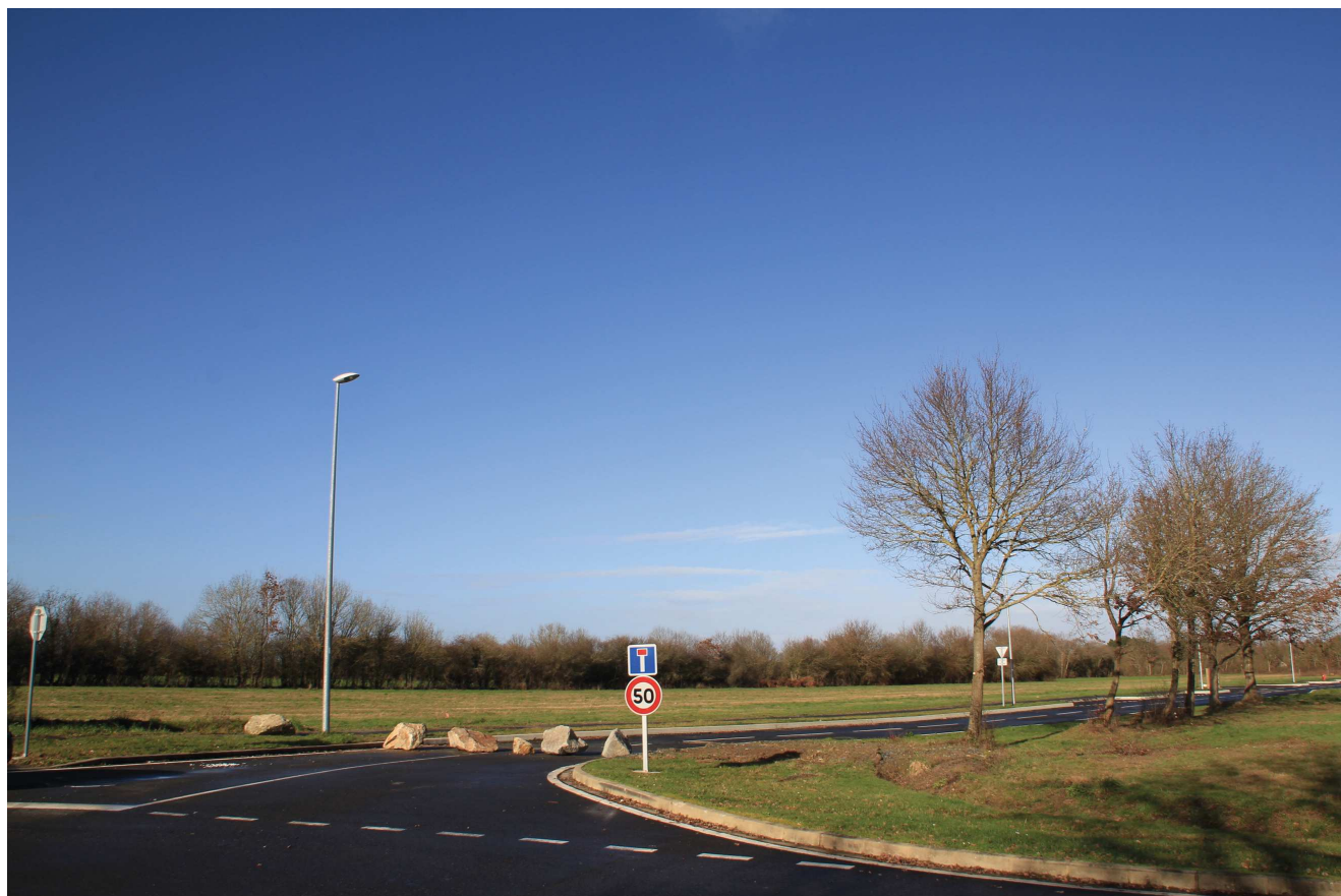
Prise de vue n°2