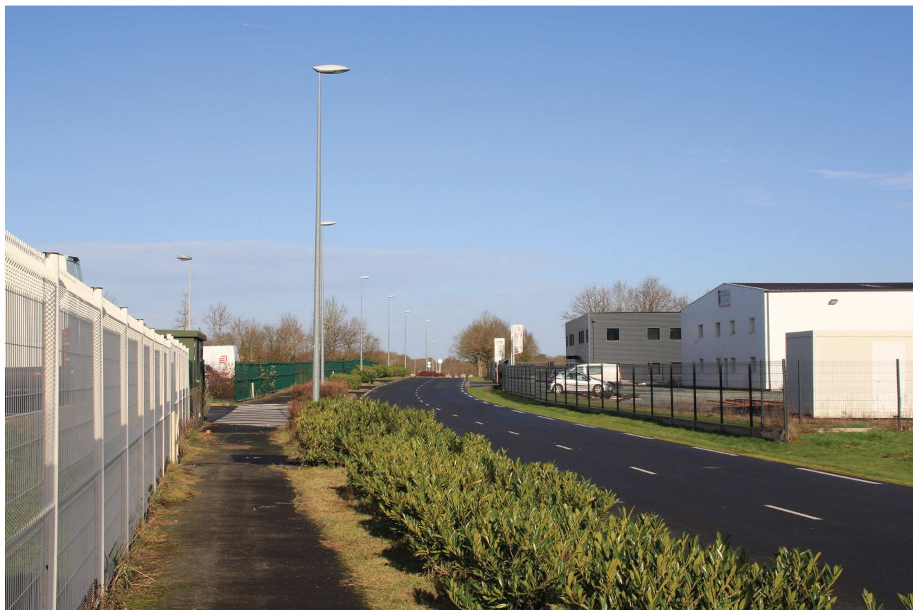
Prise de vue n°6