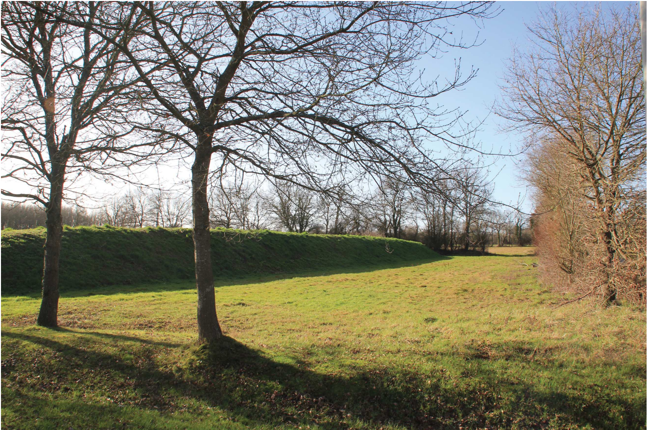
Prise de vue n°4