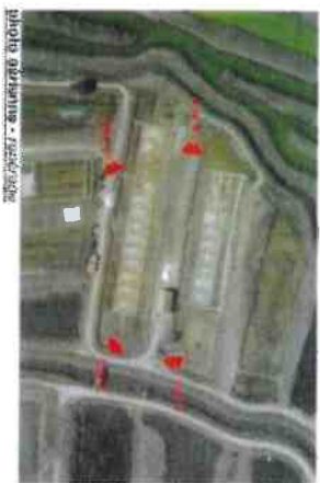
photo aérienne - septembre 2021