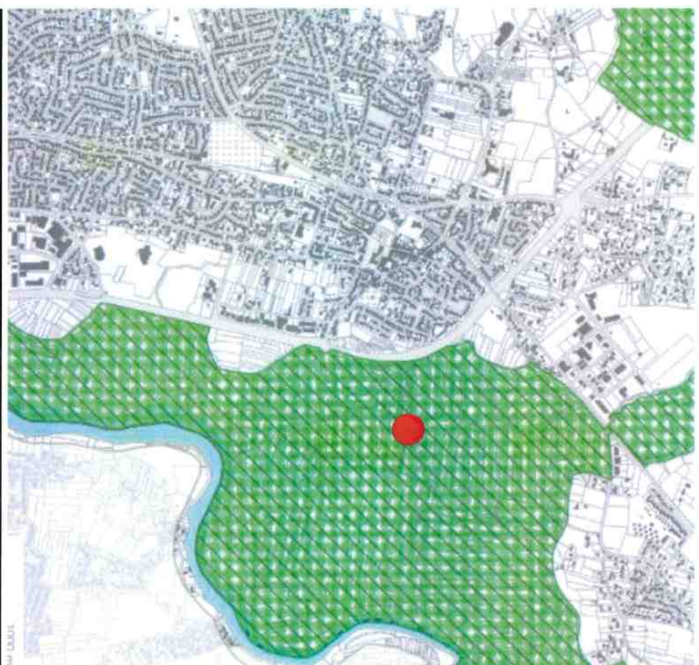
6 - Plan de situation site Natura 2000