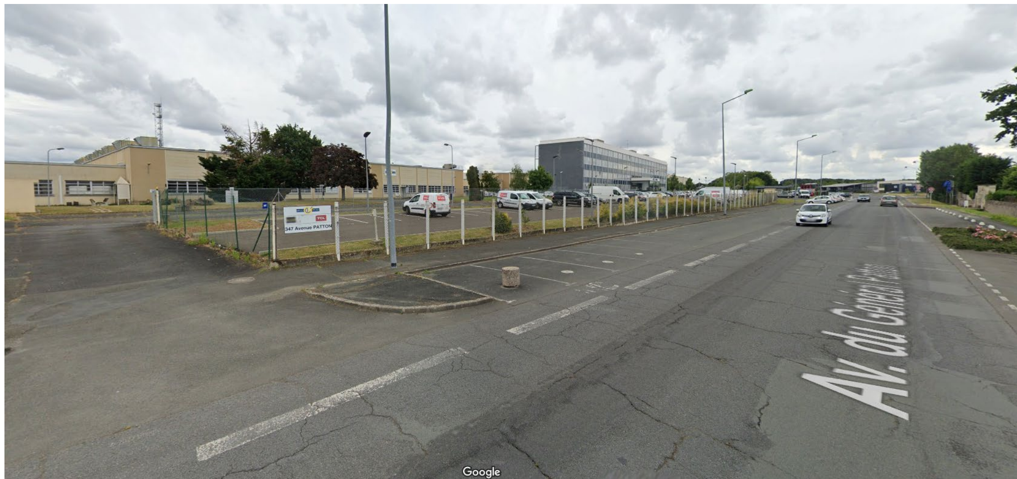
Vue 2 (juin 2019)