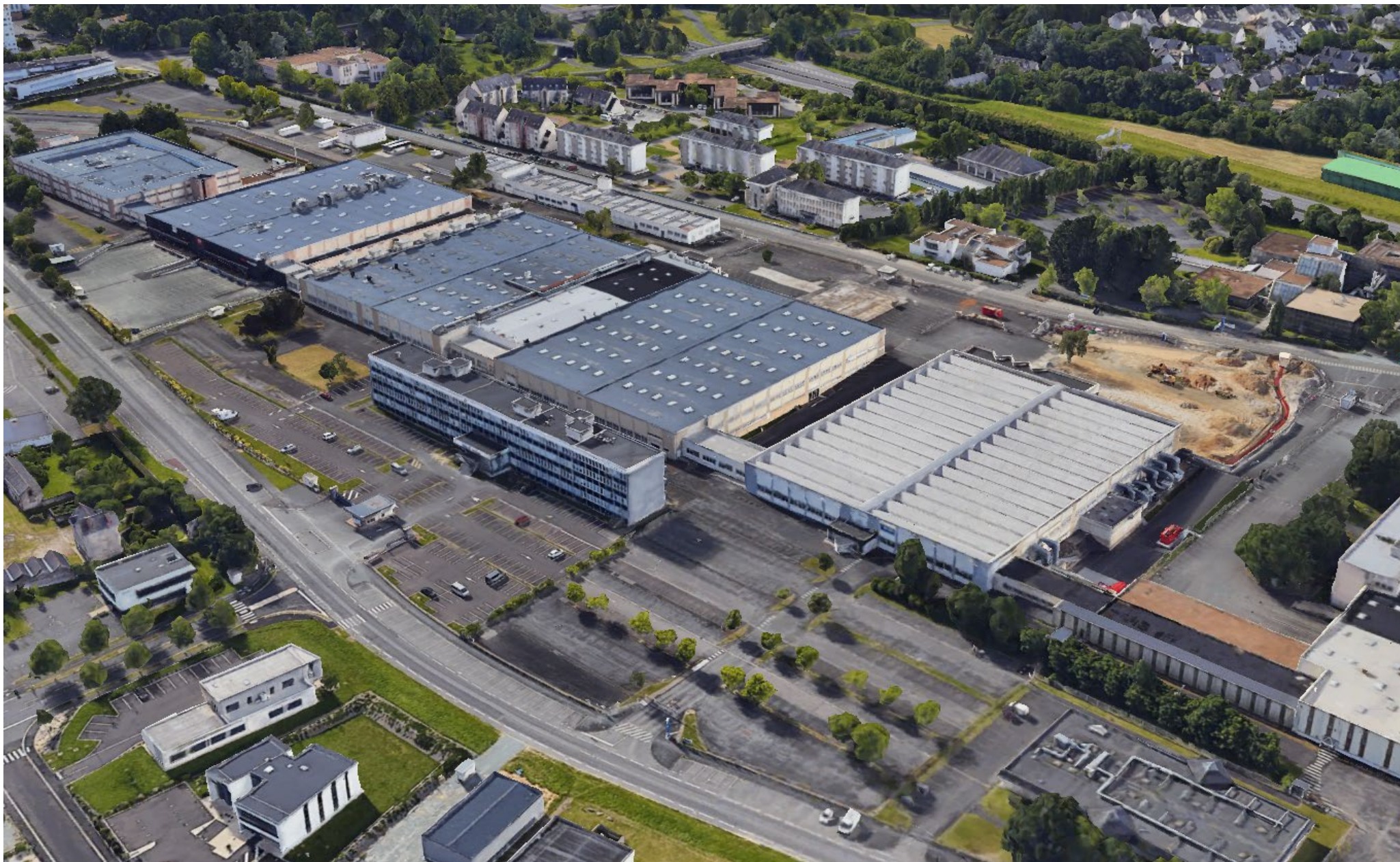
Vue aérienne du site ATOS