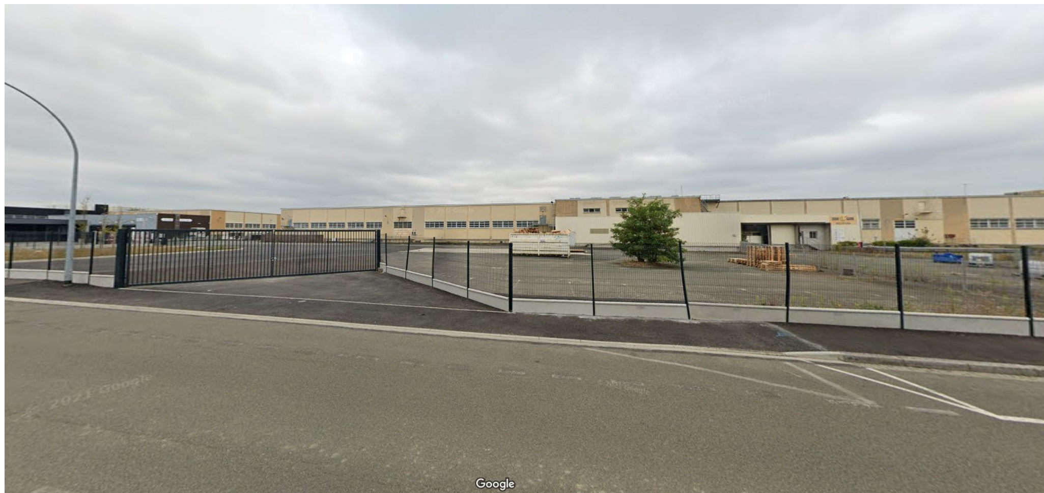
Vue 4 (août 2021)