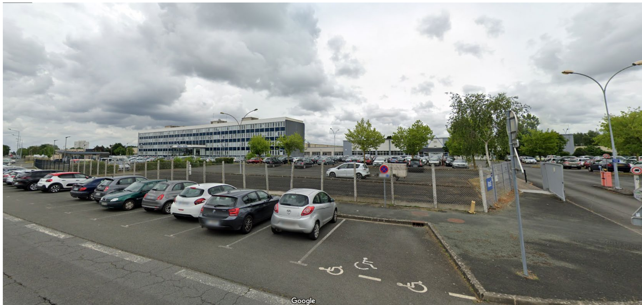
Vue 1 (juin 2019)