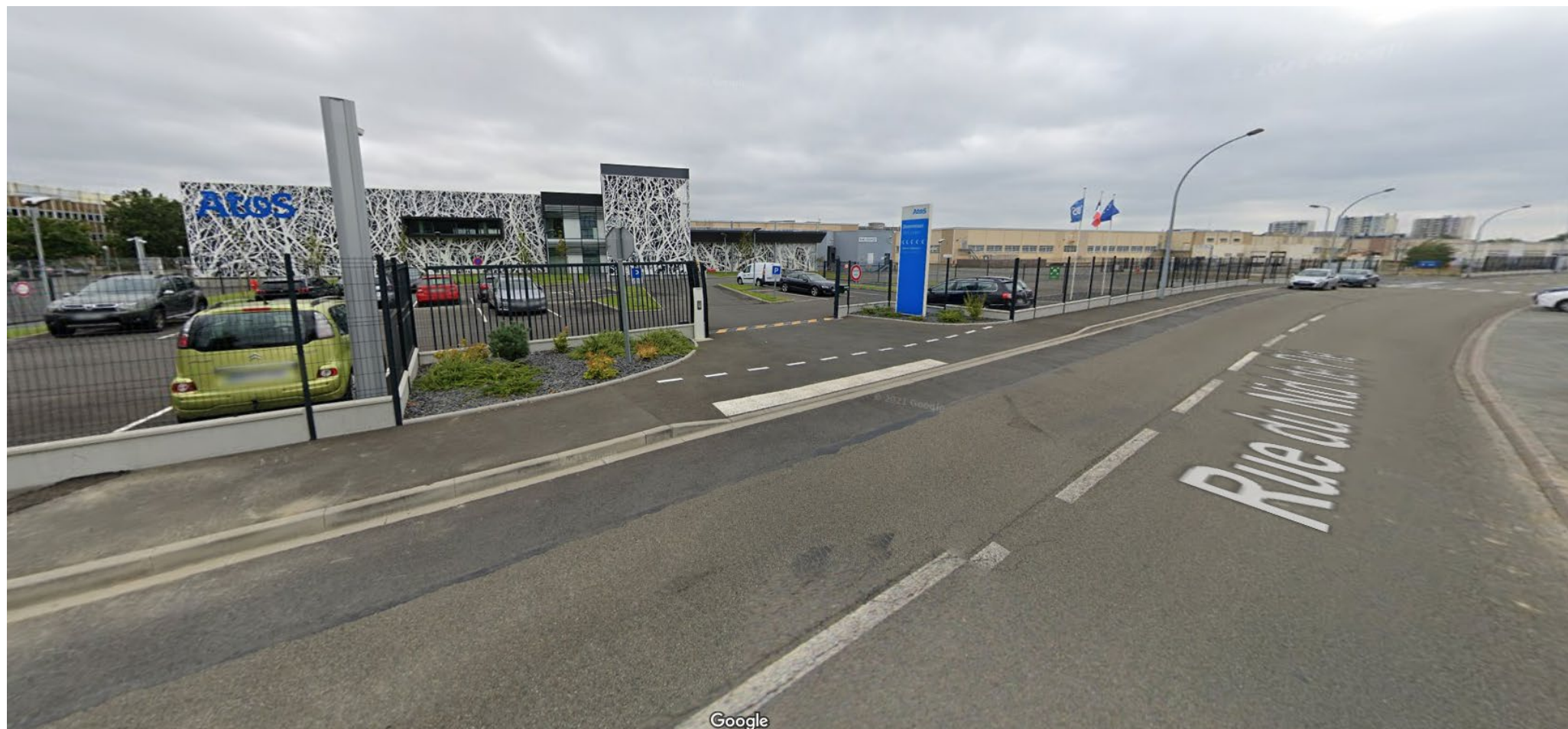
Vue 3 (août 2021)