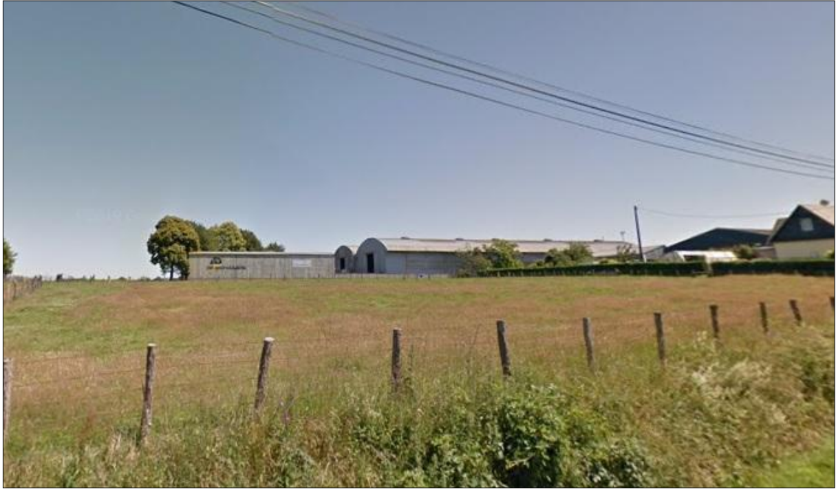
Figure 2 : Environnement lointain