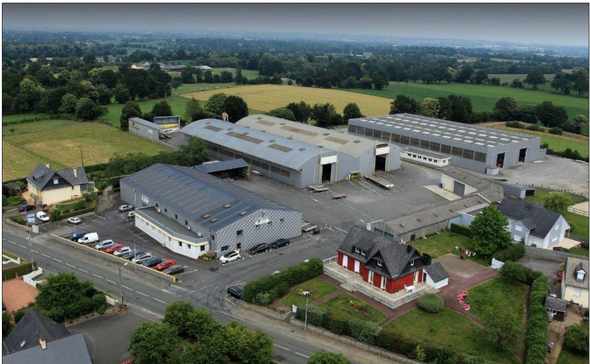
Figure 3 : Environnement proche