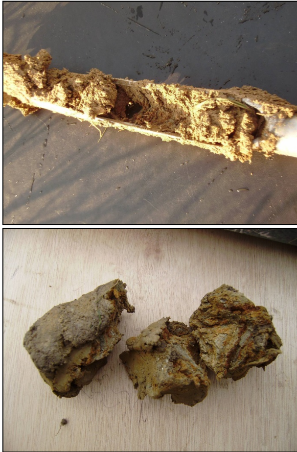
Illustrations de sondages à la tarière réalisés avec la présence de trace d'oxydo-réduction permettant d'identifier des sols hydromorphes (photos non prises sur site)

Le critère relatif à la végétation peut être appréhendé soit à partir des espèces végétales soit à partir des habitats.