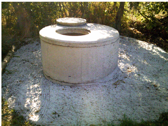
Regard béton du forage