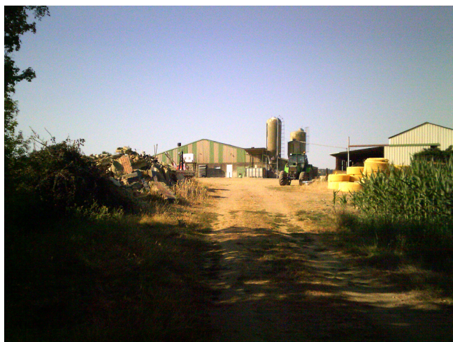
Vue direction sud