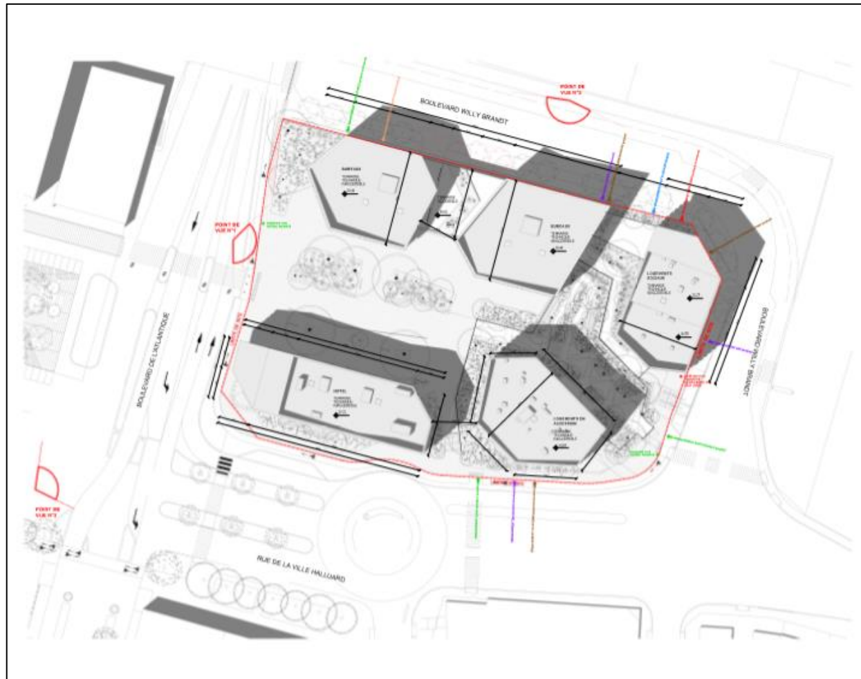
Figure 1 : Plan masse de l'opération