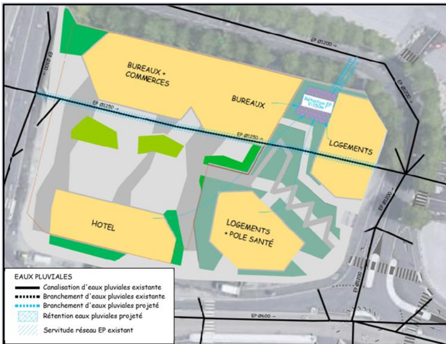
Figure 4 : Schéma de gestion des eaux pluviales