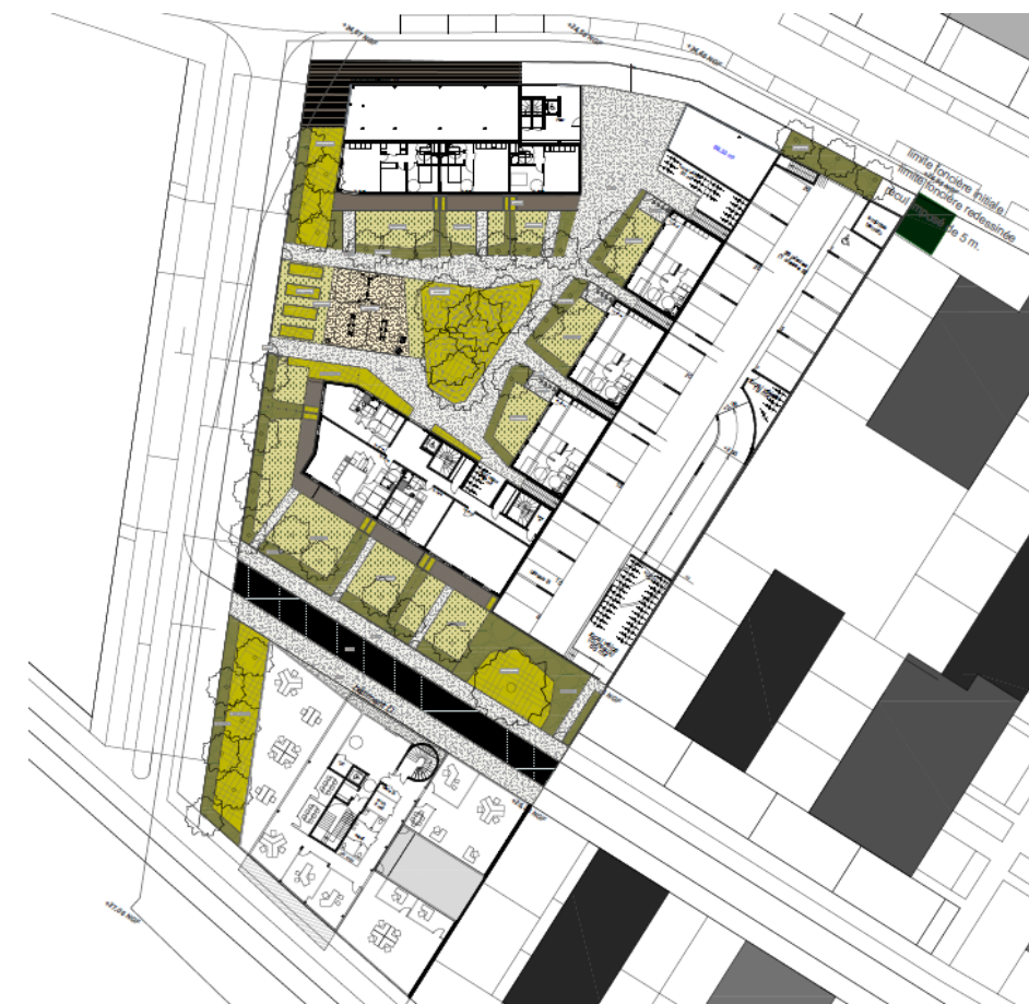
Figure 3 – plan paysage