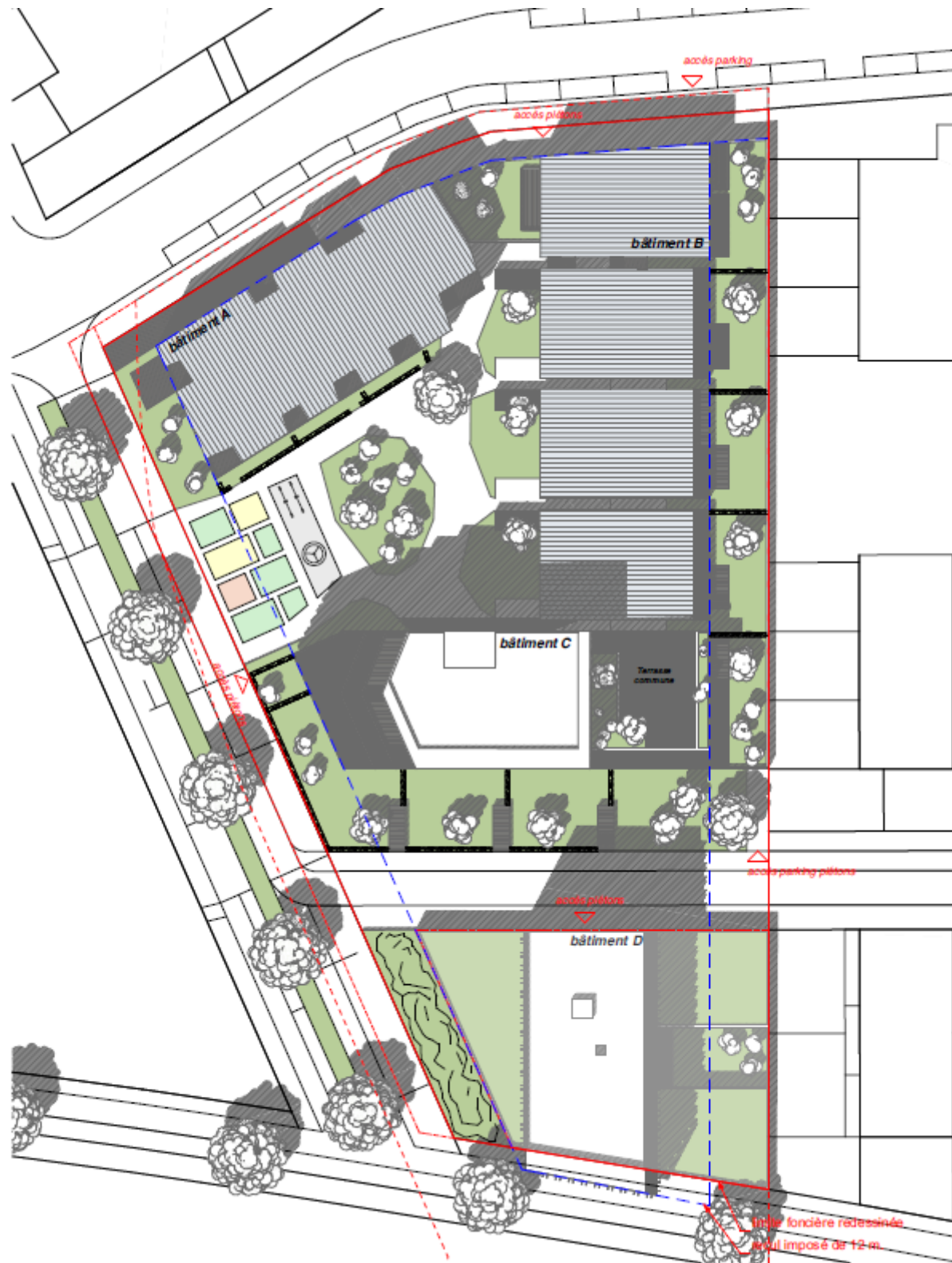
Figure 1 – Plan masse de la tranche 1