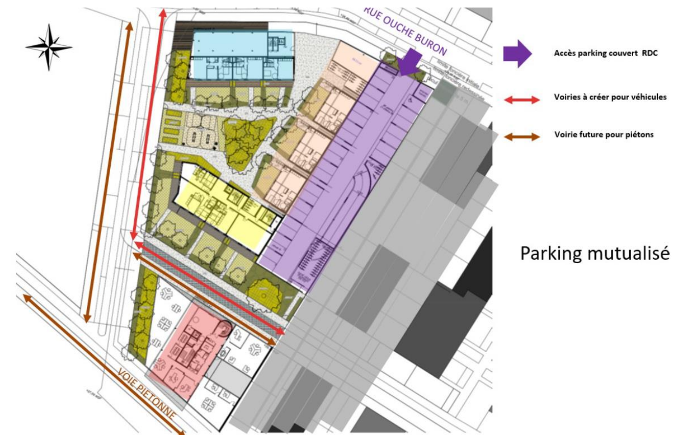
Figure 2 – Principe de desserte