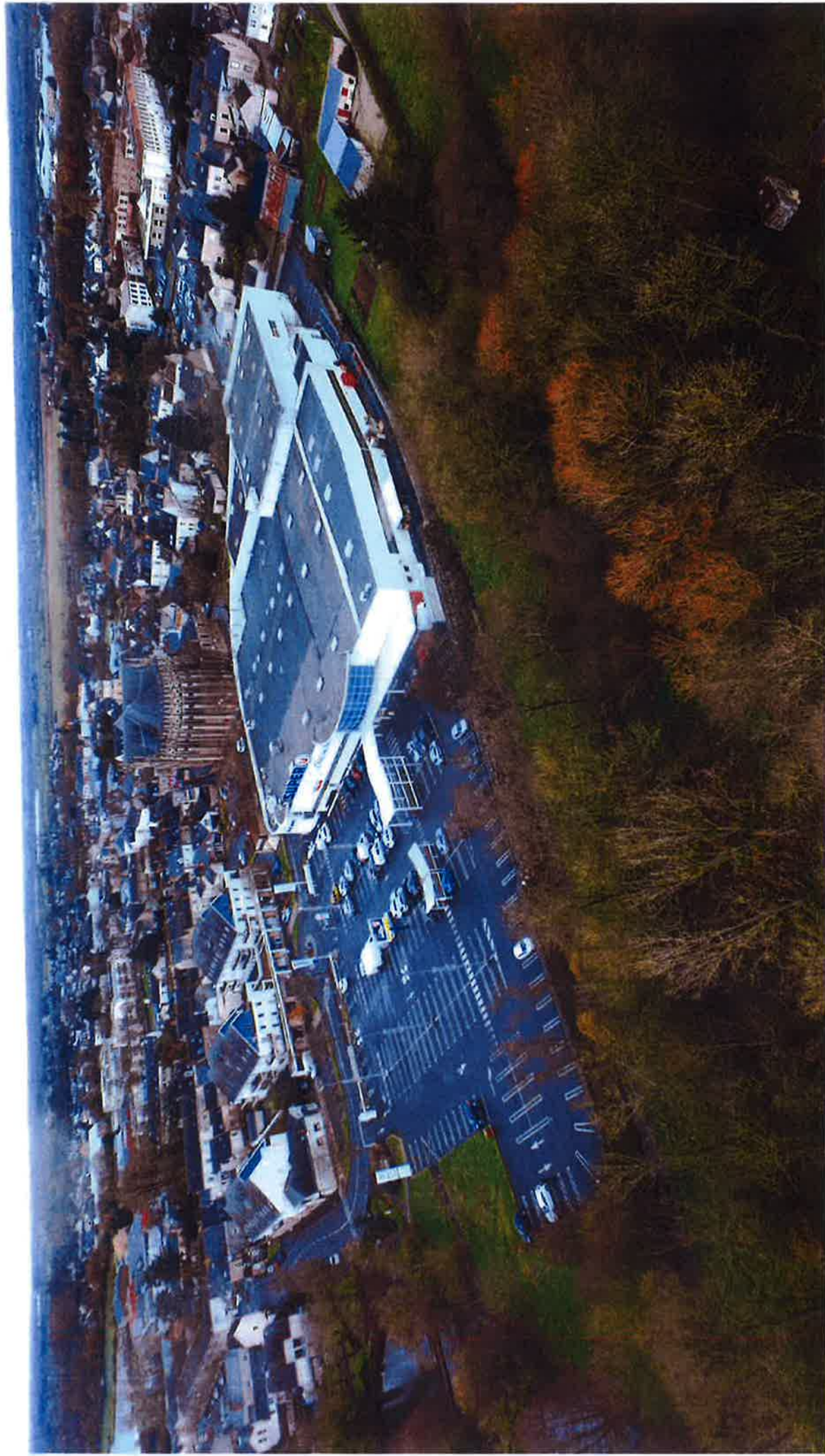
Vue aérienne (existant) A