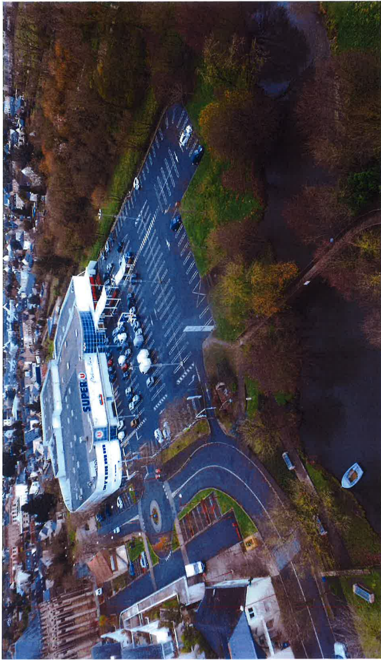
Vue aérienne (existant) B