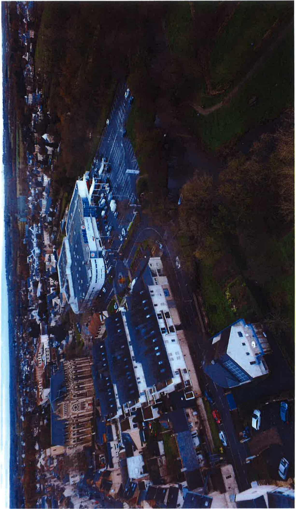
Vue aérienne (existante) C