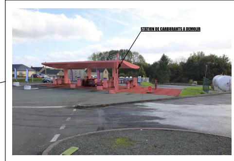
PHOTOGRAPHIES DES BATIMENTS A DEMOLIR