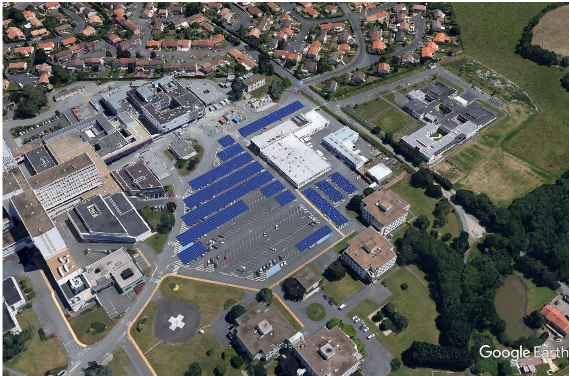
Insertion du projet sur site