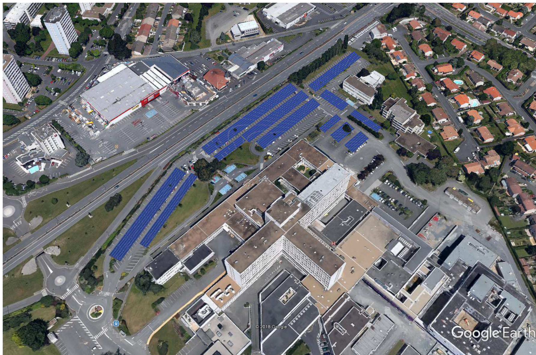
Insertion du projet sur site