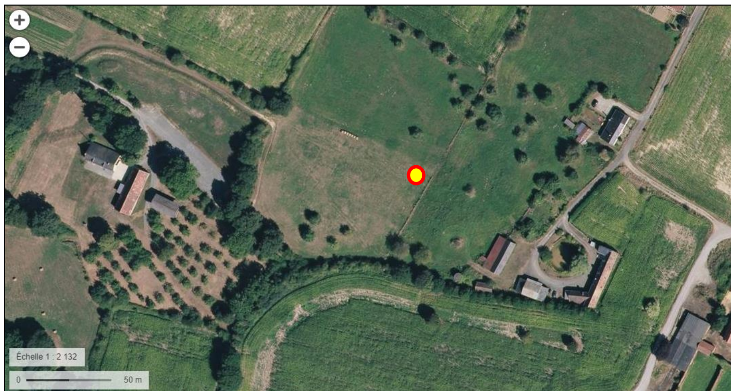
Situation du forage projeté à ROUILLON (72) sur un extrait de photographie aérienne de l'IGN (Extrait du site : geoportail.gouv.fr )