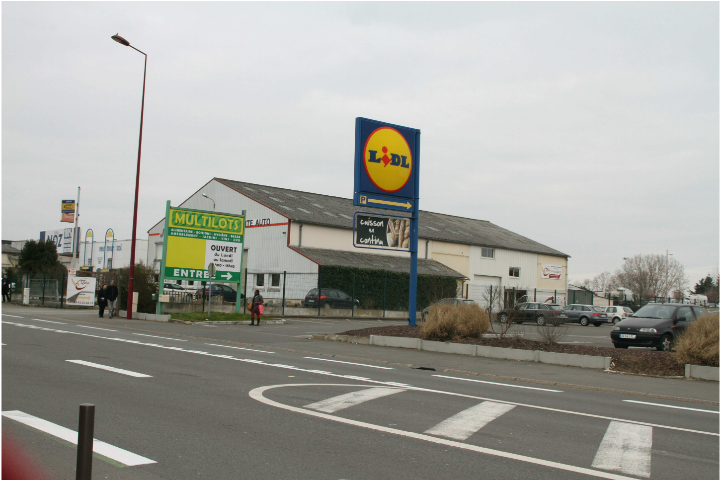
Vue depuis la Rue Thomas Edison - environnement proche