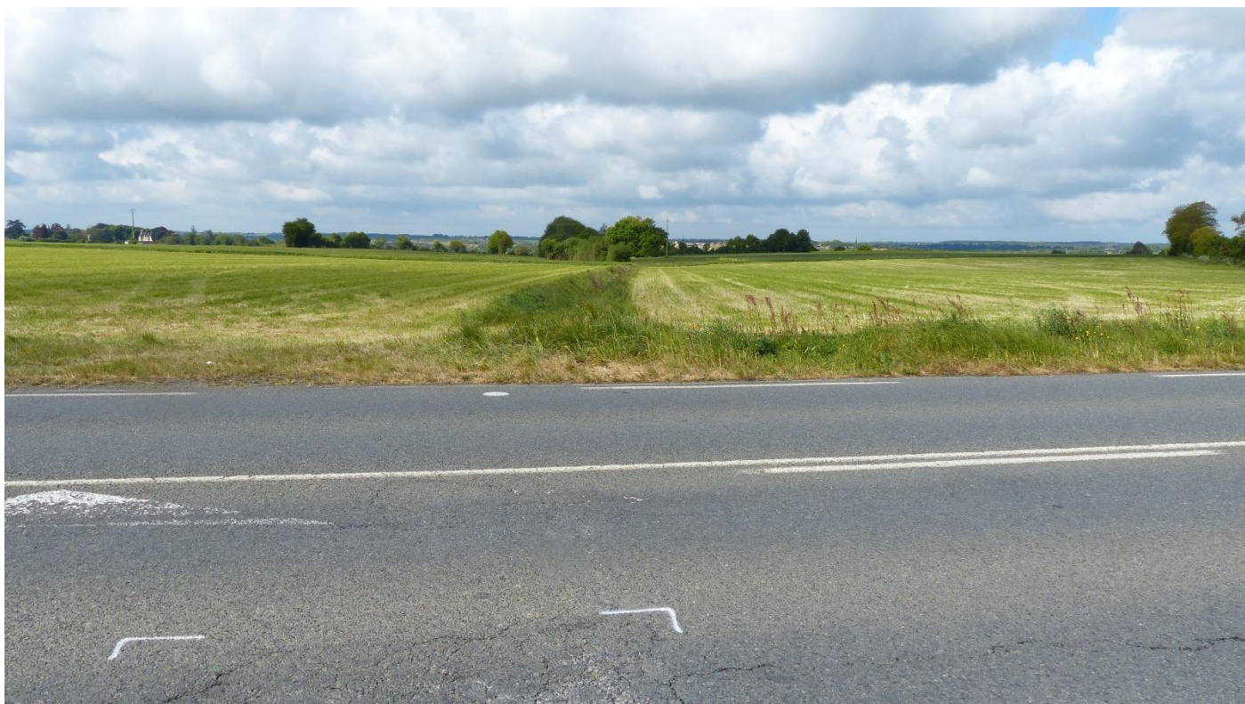
1 – RD752 existante et talweg vers l'Evre