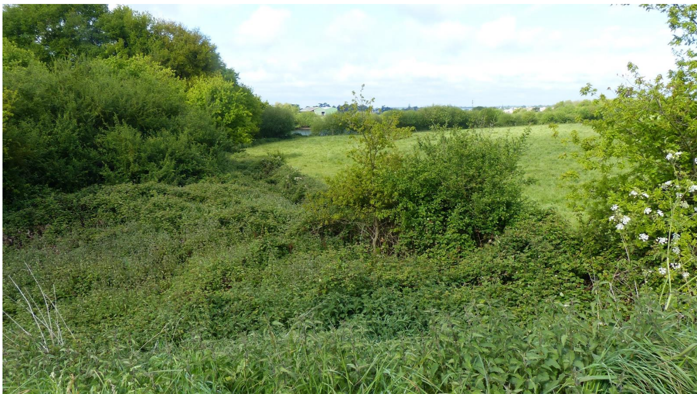
1 – Zone humide potentiellement impactée (au premier plan)