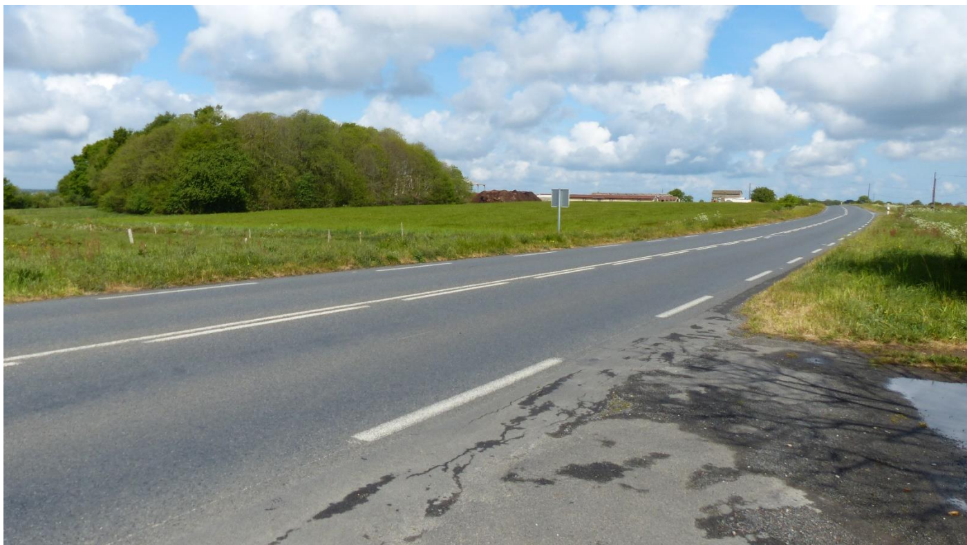
3 – RD752 à hauteur du lieu-dit le Petit-Bellevue