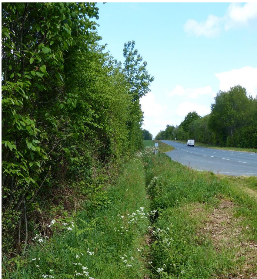
4 – RD752 et bois pour partie impacté