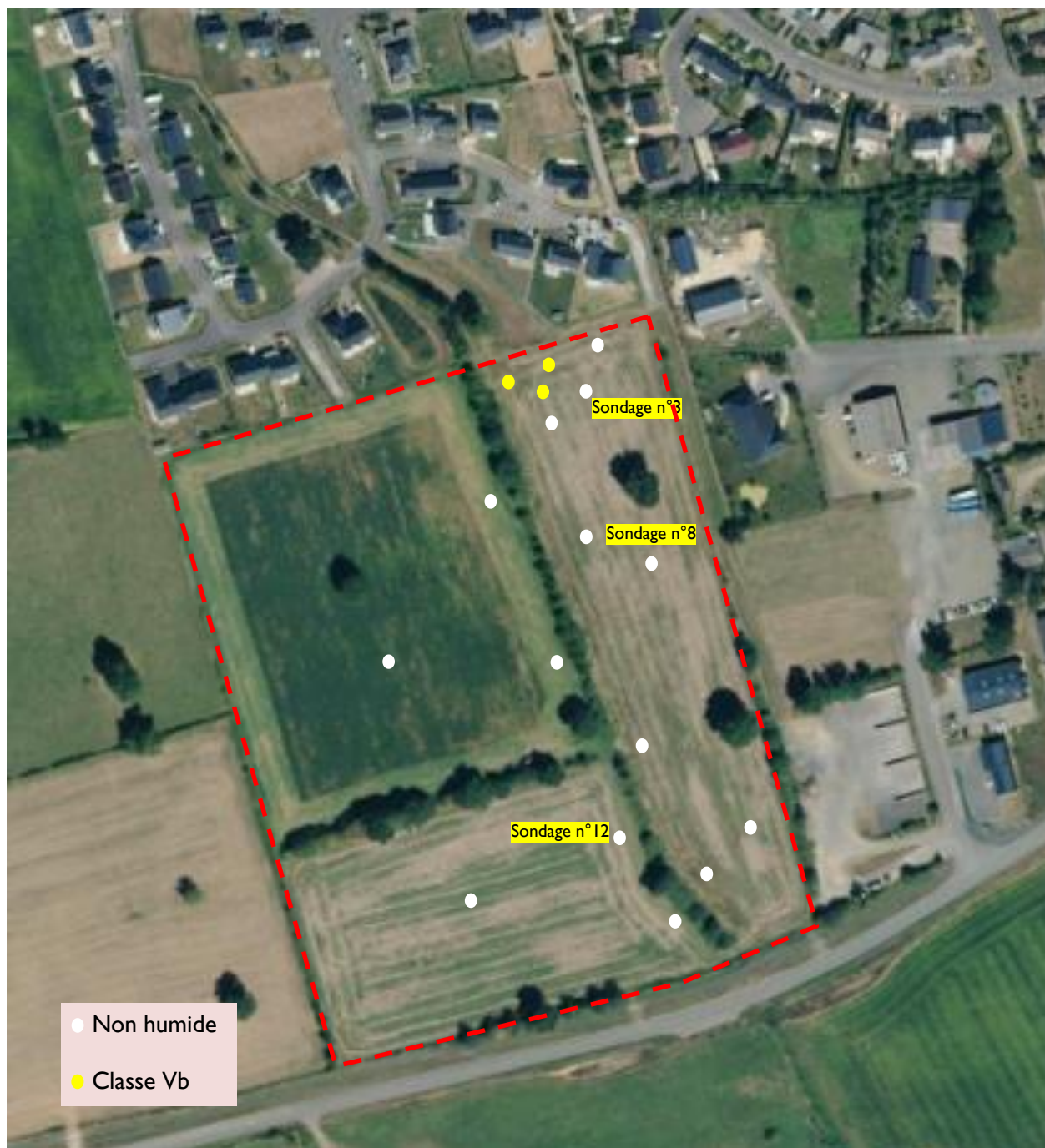
Figure 3 : Localisation des sondages pédologiques d'octobre 2018 (photos des sondages 3,8 12 page suivante)