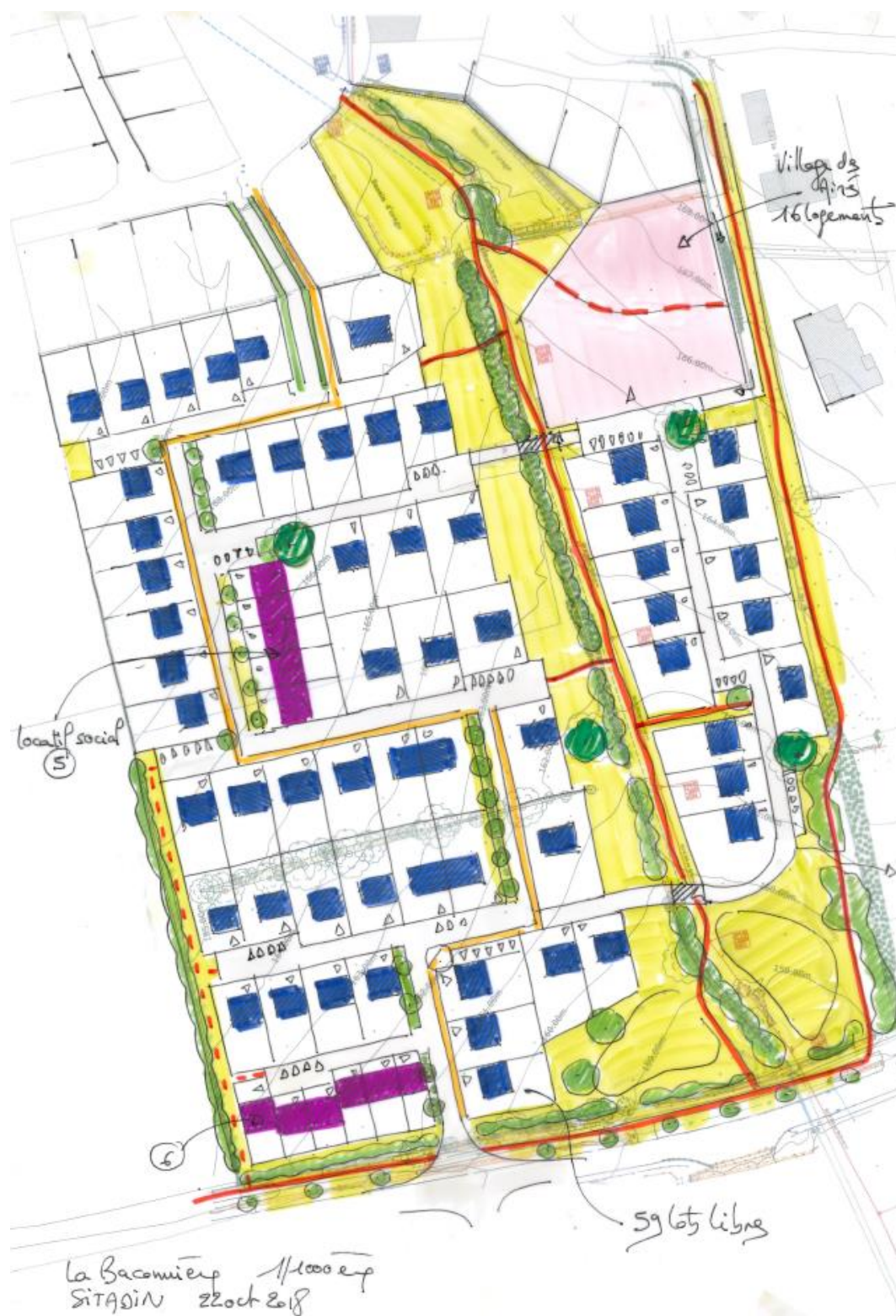
Figure 1 : Présentation de la nouvelle esquisse.

Une démarche environnementale accompagne les réflexions du projet. Depuis le dépôt de la demande de Cas par Cas, le projet a évolué (Présentation de la nouvelle esquisse ci-dessous). L'ensemble des modifications prennent en compte le diagnostic et l'état initial réalisés; notamment concernant les thématiques : zones humides et haies, objets de la demande de complément.