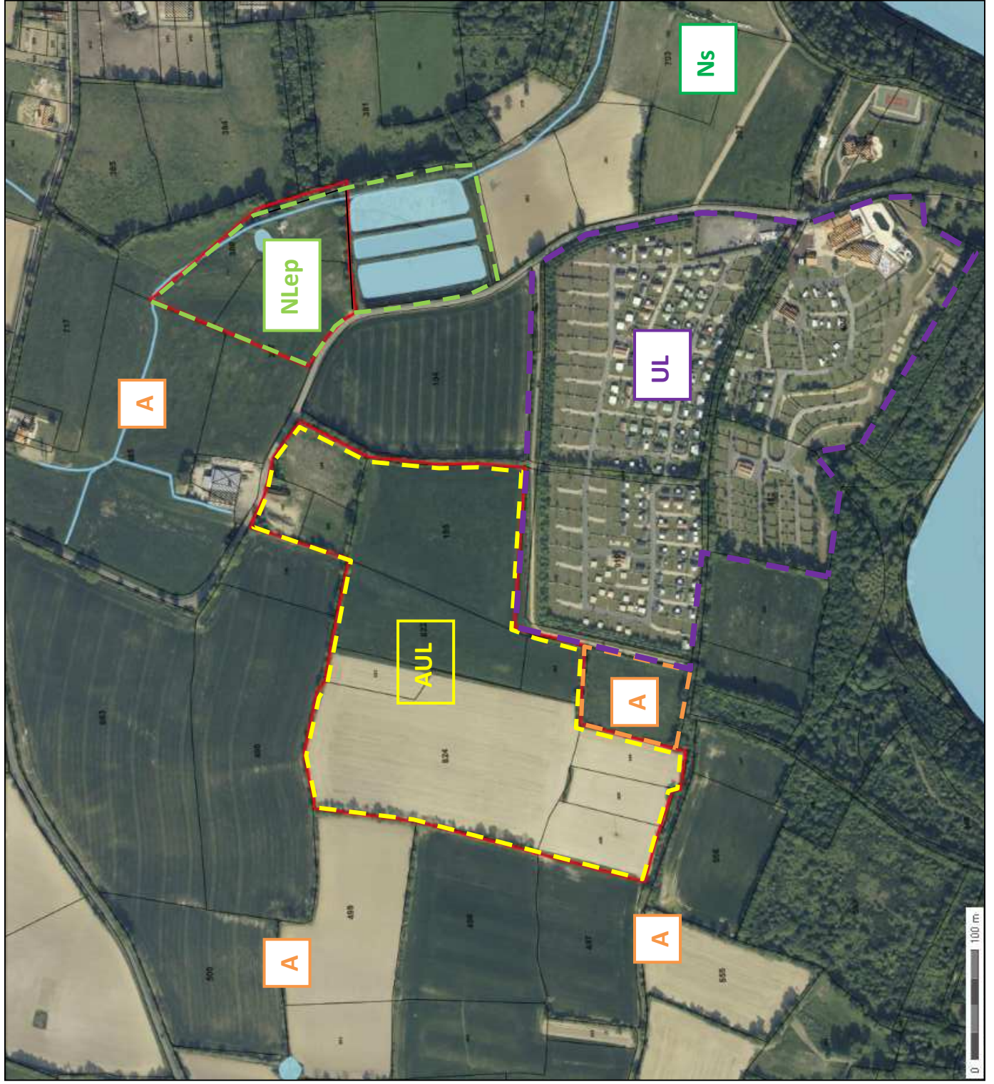
Annexe 5 : Plan du site et des abords