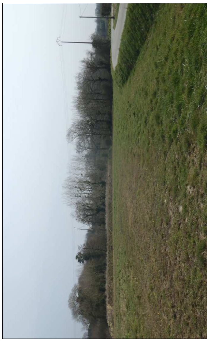
Photo 2 : Parcelles d'extension de l'assainissement occupées par de la prairie mésophile