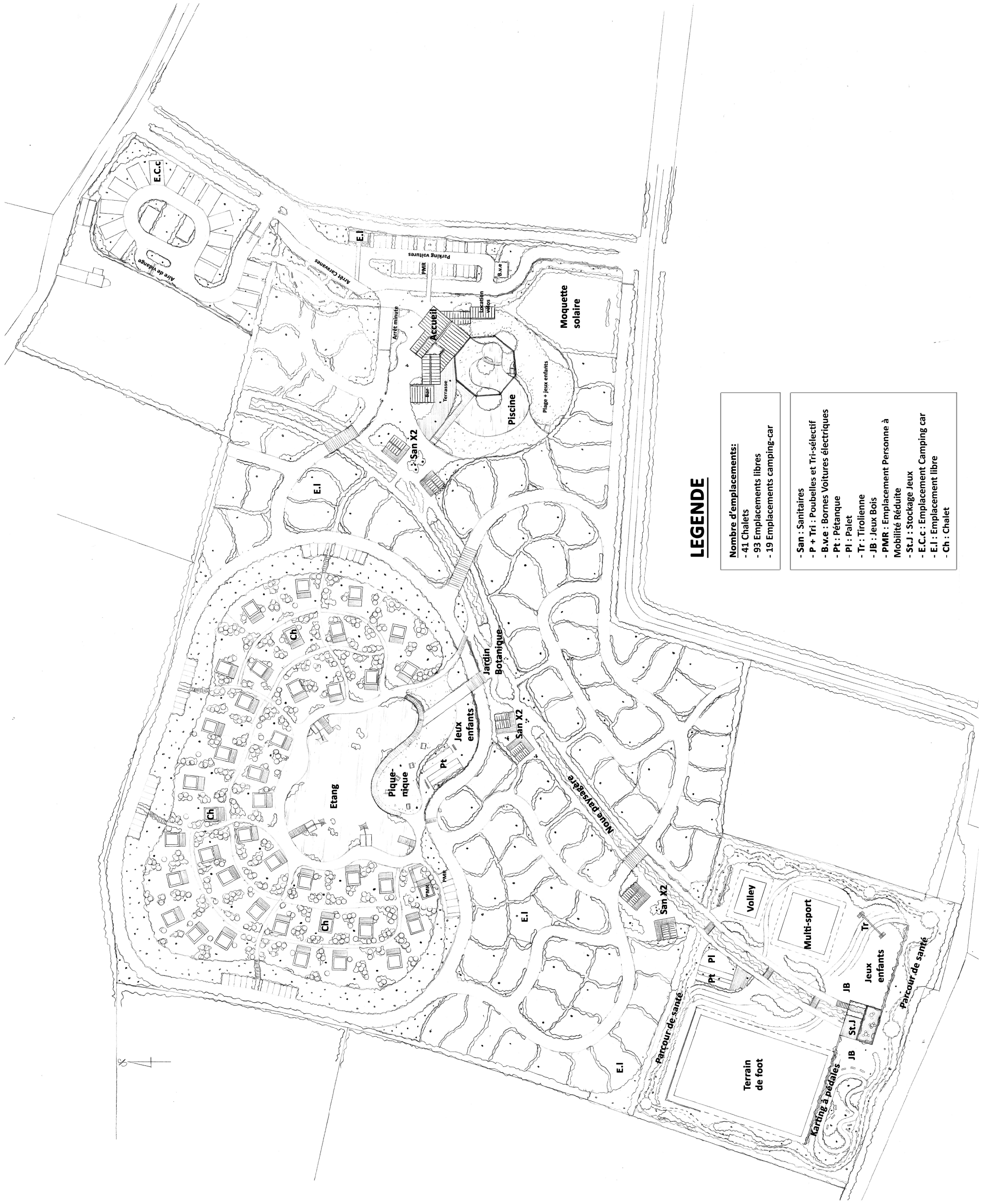
Annexe 4 : Plans de composition de l'ensemble du projet