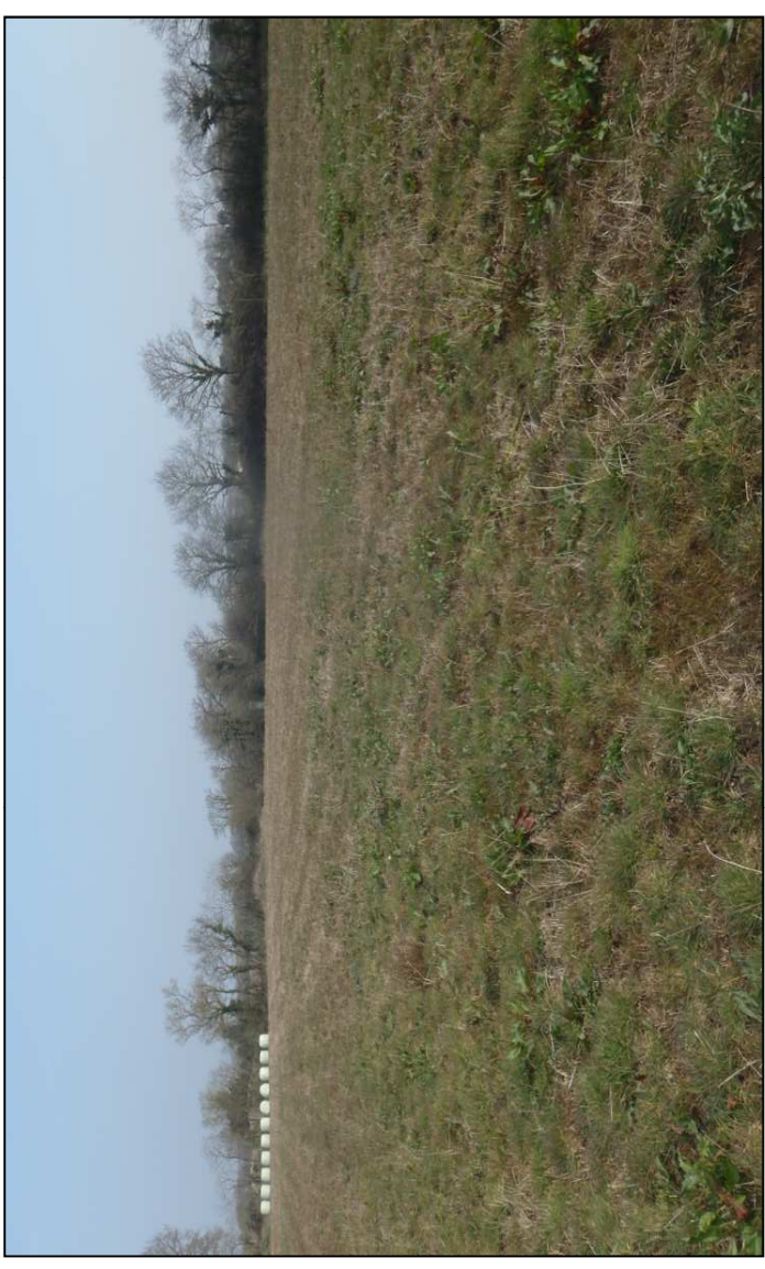
Photo 1 : Prairie mésophile présente sur les parcelles d'extension du camping