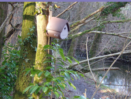
POSE DE NICHOURS EN FÉVRIER | DREAL

Les mésanges, pics, sittelles torchepots, bergeronnettes, grimpeaux des jardins et autres rougequeues noirs peuvent désormais s'y installer.