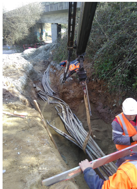
TRAVAUX DE DÉVIATION DES RÉSEAUX DE FIBRE OPTIQUE | DREAL

De nouveaux câbles seront ainsi posés dans des tranchées qui vont être réalisées. Deux forages seront également nécessaires pour mener à bien ces travaux : l'un sous le Cens et l'autre sous le périphérique. Ce nouveau tracé sera compatible avec l'élargissement de la chaussée.