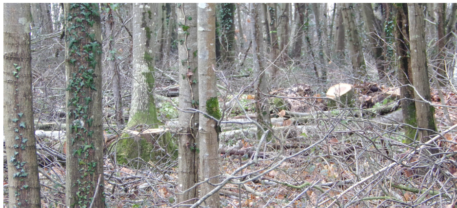
TAILLE SÉLECTIVE DE JANVIER | DREAL

Les mesures compensatoires incluent aussi la réalisation d'une zone humide, à proximité du Cens, au nord du périphérique, dont les travaux suivront prochainement.