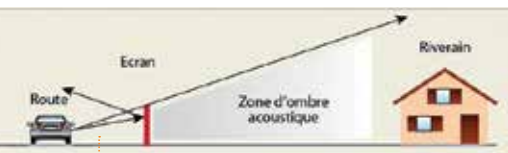
Principe de fonctionnement d'un écran acoustique.

Un premier écran d'une longueur de 328 m pour une hauteur de 2 m va être construit en périphérie intérieure, au droit de la bretelle de sortie de la porte de Rennes. La durée des travaux prévue est de quatre mois. Le second écran, situé en périphérie extérieure au droit de la voie métropolitaine 42, sera réhabilité. Les dimensions de l'écran actuel seront conservées (102 m de long, 2 m de hauteur). Les panneaux de l'écran, hauts de 1,35 m, seront entièrement changés pour une meilleure performance acoustique. La durée des travaux prévue est de deux mois.