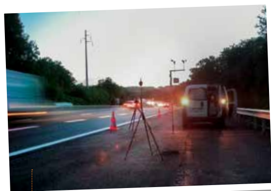
Dispositif de contrôle de performance acoustique des enrobés.

À l'issue des travaux, le maître d'œuvre fera appel à un bureau de contrôle pour mesurer la performance acoustique des écrans. Des mesures seront également réalisées en façade d'habitations pour évaluer le niveau sonore et le respect de la réglementation.