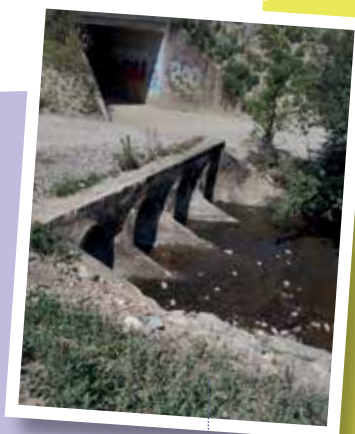
Buses en amont du Cens.

avec le soutien financier du Département de Loire-Atlantique de 3,5 M€