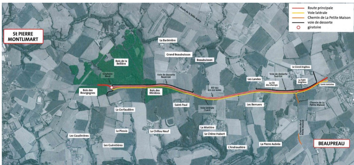
Projet initial

et engins agricoles à l'arrière du bois des Minières, entre Saint-Paul et la Croix Blanche, pour assurer la continuité de ces liaisons entre Beaupréau et Montrevault. L'aménagement sera complété par la réalisation de zones d'entrecroisement.