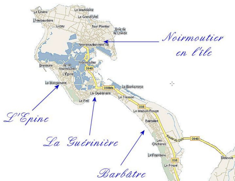
Figure 1: Territoire intercommunal de l'île de Noirmoutier

Selon le code de l'urbanisme, la collectivité disposait d'un délai de 3 ans pour mettre son document d'urbanisme en compatibilité avec le SCoT de l'île de Noirmoutier approuvé en 2008 et dont certains objectifs étaient définis pour 10 ans. Le conseil municipal de l'Épine a décidé de prescrire l'élaboration d'un PLU en 2010. Une nouvelle délibération a été prise le 28 novembre 2011 et un premier arrêt de projet du PLU est intervenu par une délibération du 16 janvier 2018, le POS étant caduc depuis le 27 mars 2017 3 . Suite aux avis rendus (Etat et MRAe) sur ce premier document arrêté, la collectivité a souhaité retravailler son projet. Ce dernier a fait l'objet d'un nouvel arrêt par délibération en date du 26 novembre 2019 et est l'objet du présent avis.