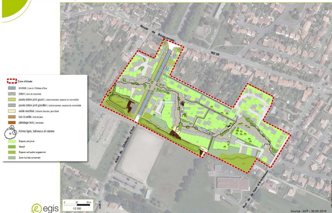
Figure 2: plan d'aménagement