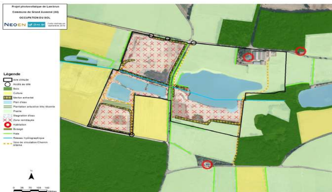
Figure 2: Carte de l'occupation initiale des sols

En termes d'enjeux paysagers, des habitations (ronds rouges sur le schéma) sont présentes à proximité immédiate. D'une façon générale, la localisation du site à la lisière d'un paysage dominé par les boisements limite assez fortement les enjeux de perception visuelle, notamment au sud du site.