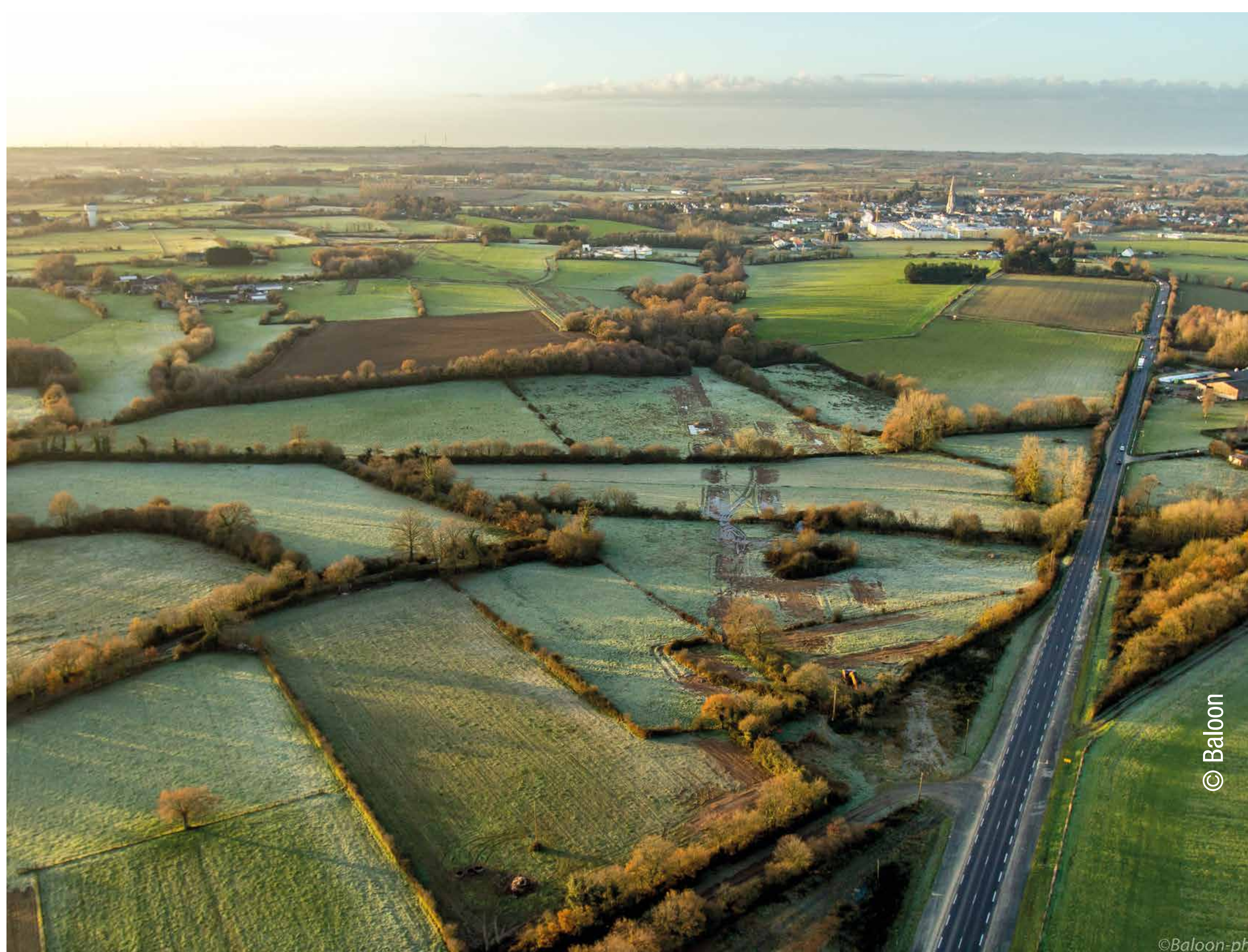
Vue aérienne de Bouvron

Le projet de déviation de Bouvron est entré dans une phase décisive de sa réalisation avec la construction des ouvrages d'art et des giratoires. Ce sont des chantiers importants qui vont durer un an. Ils seront suivis par les travaux de terrassements et de réalisation des chaussées avec comme objectifs la mise en service de la déviation début 2020. La réalisation de ce nouvel axe routier, lié par des giratoires à la RD16 et à la RN171 au nord et au sud, générera à certains des contraintes de circulation. La DREAL Pays de la Loire informera régulièrement la population par voie de presse ou via les journaux de chantier des conditions de circulation.