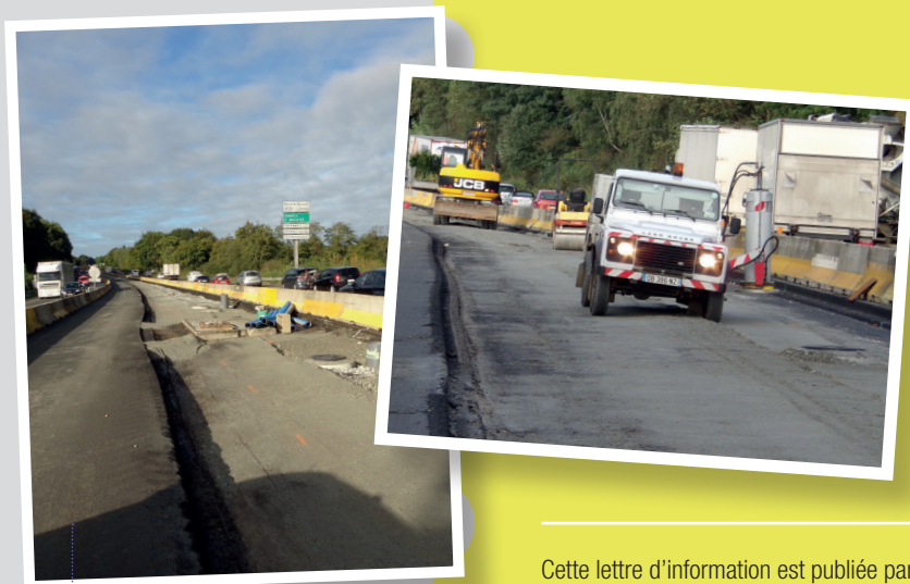
Un aperçu des travaux - octobre 2017

Service ingénierie routière ouvrages d'art (SIROA) de la Direction interdépartementale des routes de l'Ouest (DIR Ouest)