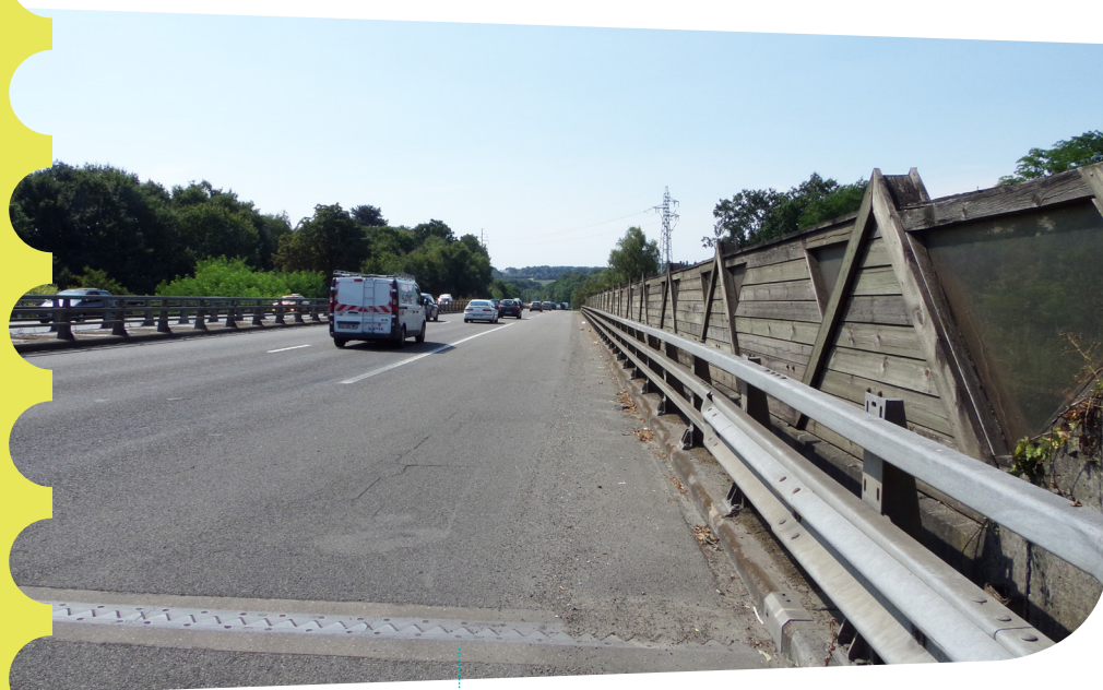
Écran acoustique sur l'A844 au droit de la RD42 qui sera réhabilité en 2019.