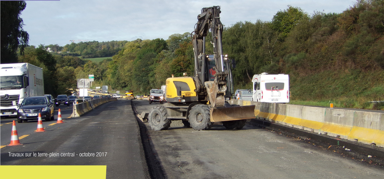
Travaux sur le terre-plein central - octobre 2017

N°3 - novembre 2017 - JOURNAL DU CHANTIER