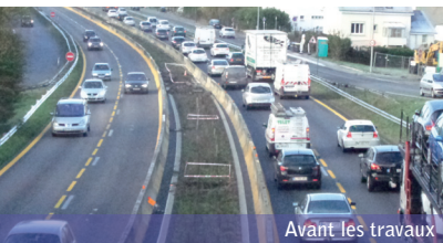
Avant les travaux