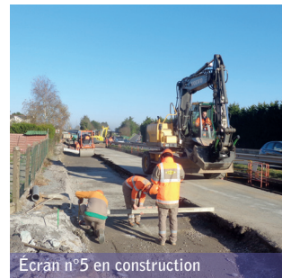
Écran n°5 en construction