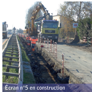
Écran n°5 en construction