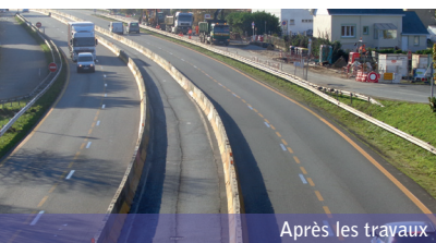
Après les travaux