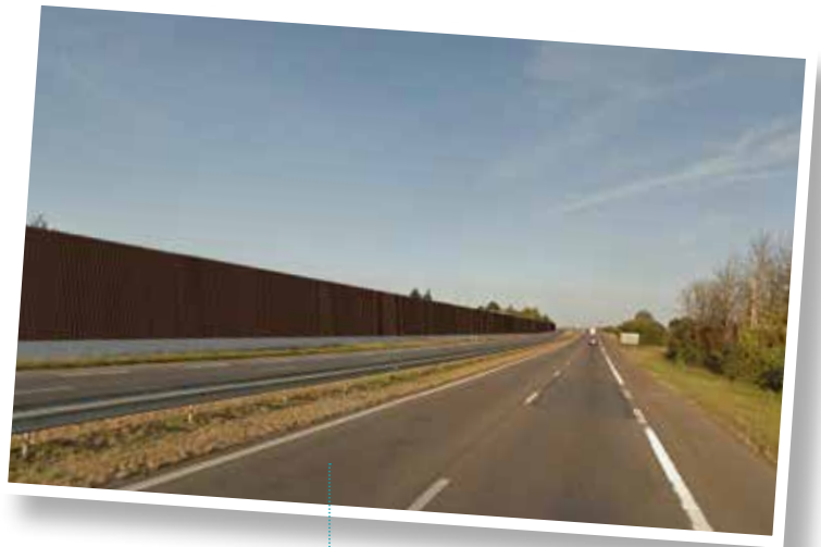
Photomontage des écrans 8 et 9

Les transports en commun : des déviations seront mises en place lors de la fermeture de la bretelle de l'échangeur des Noés (début 2018). Plus d'informations disponibles sur www.stran.fr ou au 02 40 00 75 75.