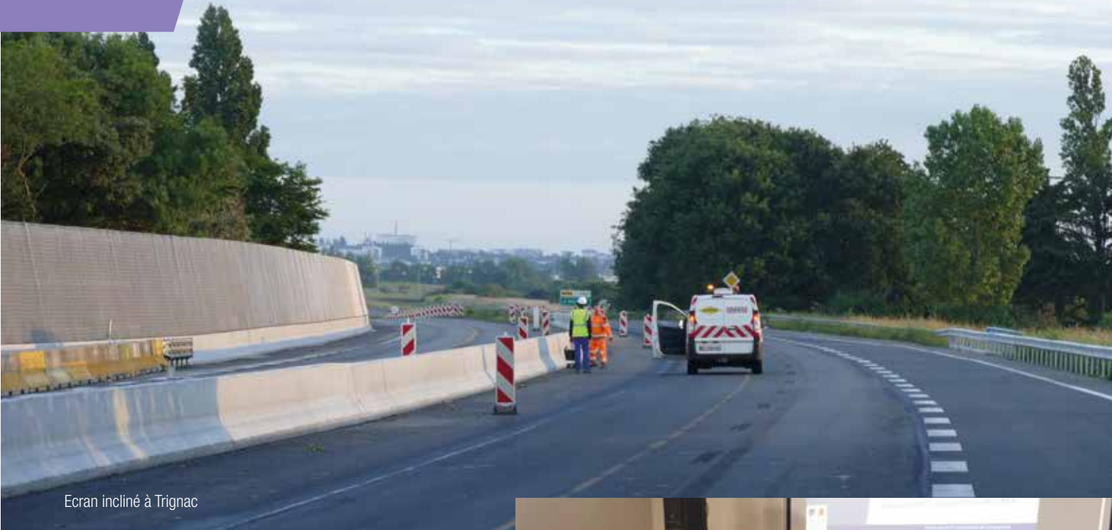
Ecran incliné à Trignac

N°1 - novembre 2017 - JOURNAL DU CHANTIER