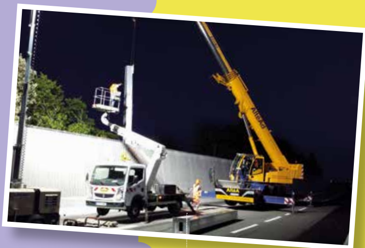
Pose des portiques de signalisation à Trignac

Bureau d'études en charge du diagnostic d'isolation acoustique des maisons individuelles : EREA