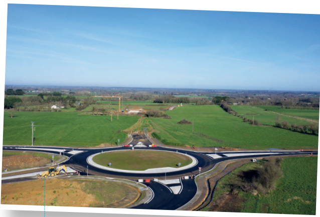
Giratoire de la RD16 et chantier de l'ouvrage d'art de la Pivolaïs en arrière plan - février 2018