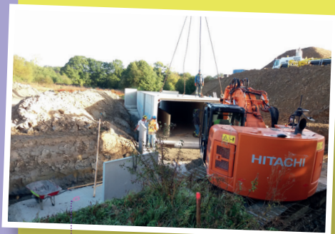
Pose de l'ouvrage hydraulique de la Farinelais

Dans le secteur de la Pivolais, la voie CR22 traversant le chantier de l'ouvrage d'art sera fermée jusqu'à juin 2018.