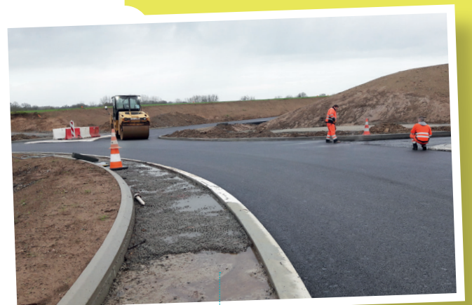
Giratoire Nord - février 2018