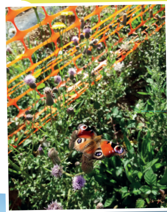
Balisage d'une zone sensible