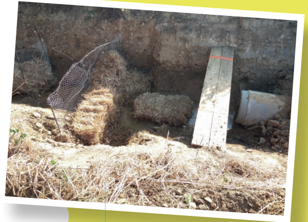
Filtration des eaux au niveau du passage inférieur du Chatel

Ainsi, il s'assure du respect des engagements pris par le maître d'ouvrage et l'assiste dans le choix de solutions techniques les plus cohérentes d'un point de vue écologique.