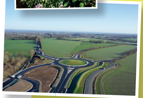
Giratoire du Haut-Bezoul - février 2018