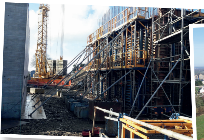
Travaux de l'ouvrage d'art de la Pivols - janvier 2018

Le bureau d'études SEGED est le maître d'œuvre de ces travaux et l'entreprise sera sélectionnée avant l'été 2018 après appel d'offres.