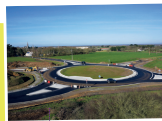
Giratoire de la RD16 février 2018