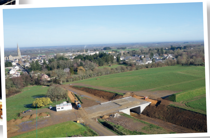
Passage inférieur du Chatel - février 2018