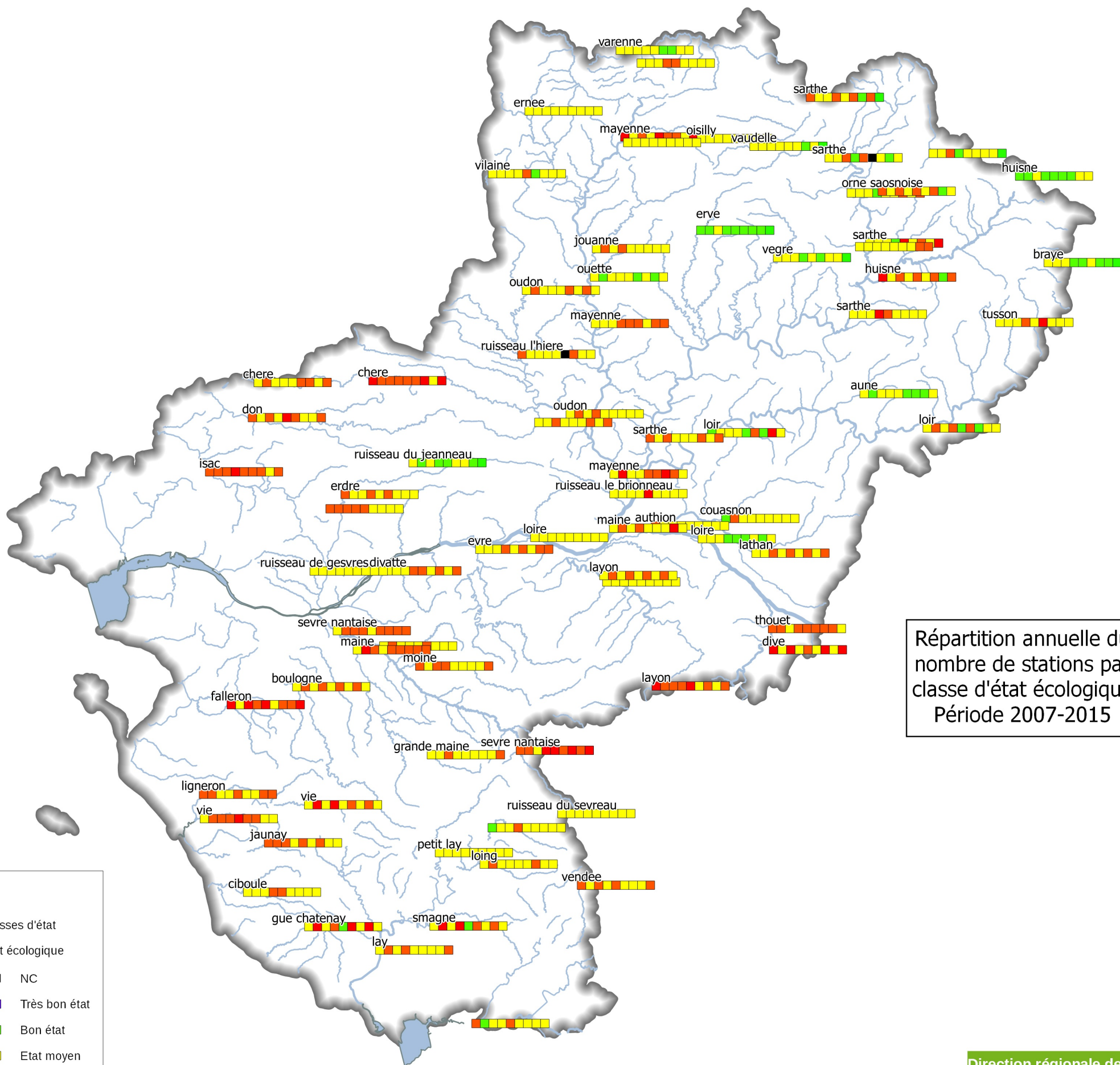
Répartition annuelle du nombre de stations par classe d'état écologique Période 2007-2015