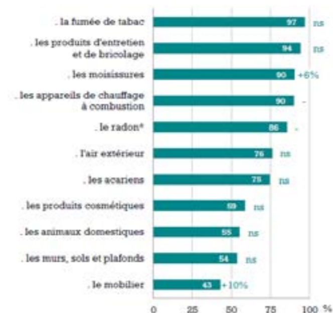
Identification des polluants de l'air intérieur et évolution par rapport à 2007

* Parmi les personnes qui en ont déjà entendu parler