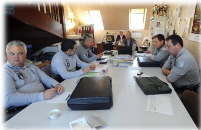
Agents de l'ONCFS – SD de la Sarthe

Le CEN Sarthe a rencontré l'ensemble des agents représentant la police de l'environnement dans le département de la Sarthe le 9 mars 2014. Il a notamment été question des menaces qui pesaient sur l'ensemble des sites abritant les Maculinea et surtout sur les habitats à Azuré des mouillères. Les agents de l'ONEMA et de l'ONCFS ont intégré dans leur circuit certains sites afin d'assurer une présence.