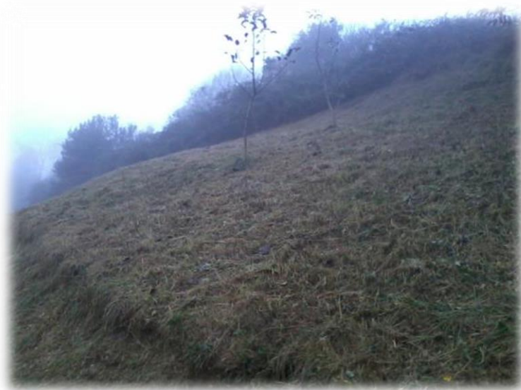
Coteau de Villeclair à Avoise. Réouverture des pelouses calcicoles.