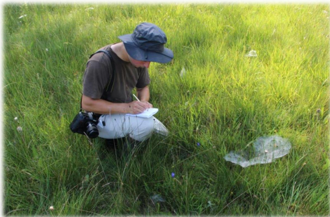
Comptage des œufs de Maculinea alcon alcon par le CEN Sarthe en Vallée des Cartes en juillet 2014 (CEN Sarthe)