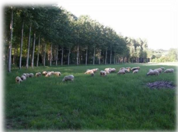
Prairie des Deux-Eves pâturée par des brebis gasconne.

Une convention avec des agriculteurs biologiques (production de fromage de brebis) a été mise en place sur la commune de Savigné-sous-Le-Lude, afin de préserver une station de Gentiane pneumonanthe .