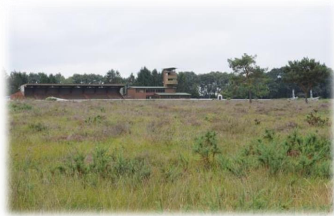
Landes de l'hippodrome de Mespras, photographie CEN Sarthe.

En 2014, le CEN Sarthe a rencontré l'ONF pour essayer de restaurer certains pare-feux. Une action de restauration pourrait être engagée en 2015.