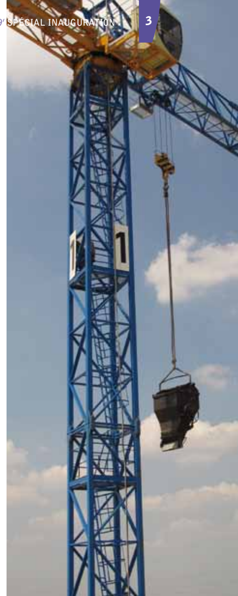
LES TRAVAUX | EXALTA