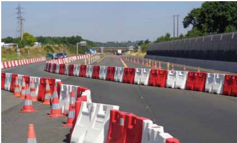
UN CHANTIER SOUS EXPLOITATION | DIRO

avec l'ensemble des autres acteurs de l'opération, à fournir une information régulière aux usagers, riverains et acteurs économiques locaux sur l'avancement des travaux et les conditions de circulation.