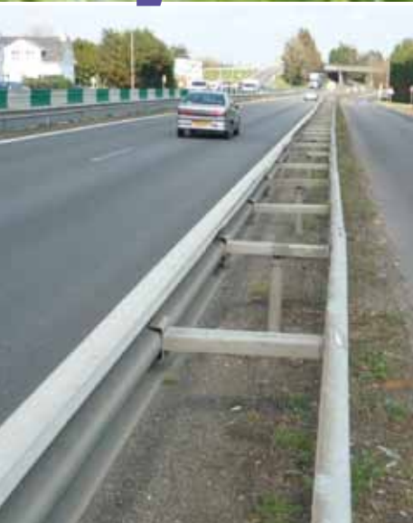
LA RN171 À TRIGNAC