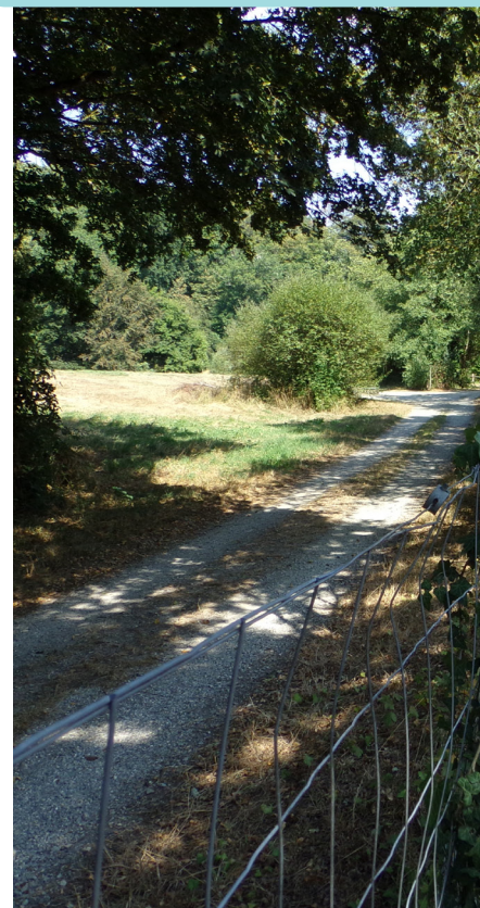
LE CHEMIN DE RANDONNÉE | DREAL

Le chemin de randonnée sera, quant à lui, ouvert uniquement le week-end pendant cette première phase, puis réouvert totalement jusqu'au début des travaux de voirie.