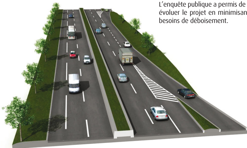
PRINCIPE DE FONCTIONNEMENT D'UNE VOIE AUXILIAIRE D'ENTRECROISEMENT | EXALTA

Une voie d'entrecroisement est une voie supplémentaire facilitant les échanges entre deux portes successives en reliant leurs entrée et sortie.