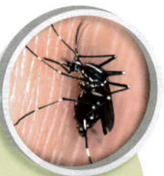
moustique tigre ( Aedes albopictus ) taille réelle : 5 mm

Une attention particulière est portée sur le moustique tigre ( Aedes albopictus ), petit moustique noir rayé de blanc (5 mm), vecteur potentiel de la dengue et du chikungunya.